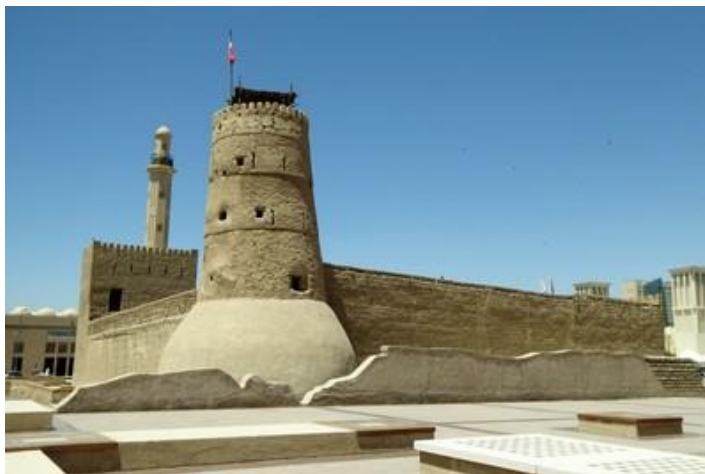
Fort Al Fahidi (1999), Dubaï