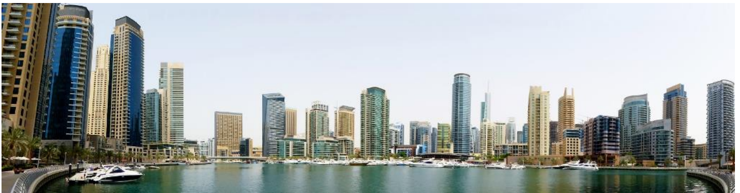
Dubaï Marina, Dubaï

Mais je ne suis pas venu là pour faire les boutiques, non, je voulais juste voir le Dubaï Ski, la fameuse station de ski couverte dont on fête cette année dixième anniversaire. C'est hallucinant ! La piste fait 400 m de long et la station de 22 500 m 2 peut accueillir 1 500 personnes en même temps. Elle produit chaque nuit 30 tonnes de neige. Mais ça ne me plairait franchement pas de skier ici. Pour moi, le ski, c'est aussi le contact avec la nature, la montagne... D'autres activités sont proposées : cours de ski, bobsleigh, jardin d'enfants, randonnée etc... Plusieurs forfaits, mais pour skier 2H c'est 50 euros, matériel compris. C'est raisonnable. Je ne vais pas skier ce matin, pas là pour ça, mais je peux voir la station derrière de grandes baies vitrées donnant dans le centre commerciale, mais mes photos ne sont pas bonnes.