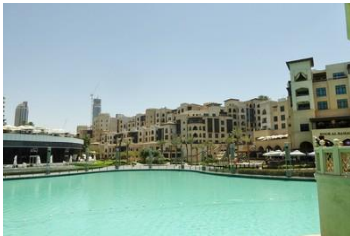
Bassin du Dubaï Mall, Dubaï