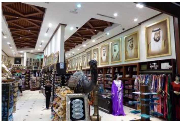
Boutique dans le Dubaï Mall, Dubaï