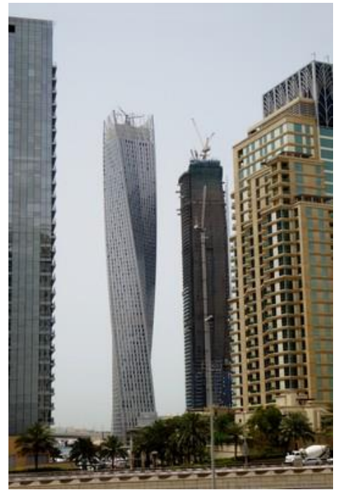
A New Dubaï, Dubaï

Vers 18H30 je récupère mon sac à dos, règle l'addition, et repars, chargé comme une mule, jusqu'au métro. Cinq stations plus loin, il me laisse à 300 m du Centre Etihad. Je peux y prendre une douche (mais pas de serviette pour me sécher, j'utilise le séchoir à mains, pas facile, contorsions et acrobaties qui mériteraient une petite vidéo !).