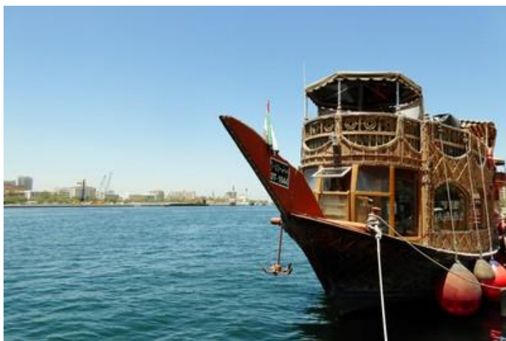
Dhow, Dubaï Creek, Dubaï

Me voilà dans le quartier de Bur Dubaï, où se trouvent de nombreuses mosquées de style différent.