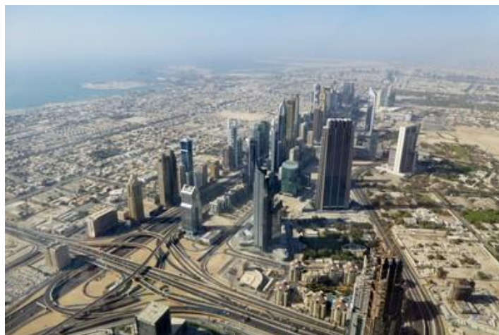
Vue depuis le 148 ème étage du Burj Khalifa (828 m), Dubaï

Samedi 2 : Réveil 6H30, bonne nuit, en meilleur forme. Il fait déjà grand jour et très beau (36° annoncé aujourd'hui). Travail jusqu'à presque 10H. Mon ordi plante deux fois, je suis inquiet, ce n'est pas la première fois ; redémarrage etc.