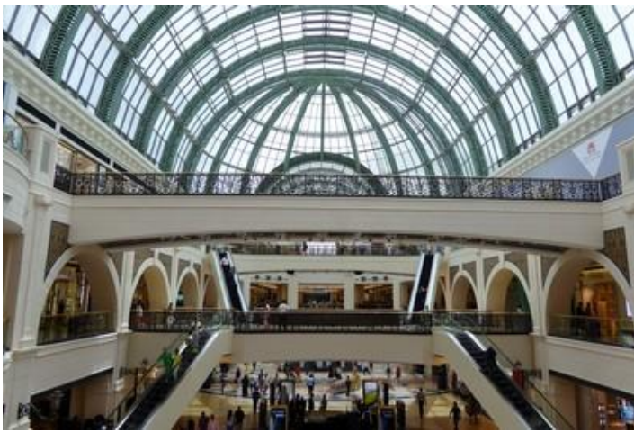
Mall of the Emirates, Dubaï