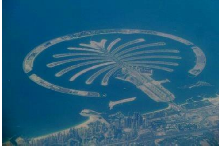
Survol de Dubaï, le Palm Dubaï (2012)

Lundi 4 mai 2015 : Je me réveille encore bien trop tôt, vers 6H30. Beaucoup de travail, je n'aurai encore certainement pas le temps de profiter de la piscine ! J'attends 10H pour aller prendre mon petit-déjeuner qui me servira aussi de déjeuner. Il fait beau, 38° annoncé.