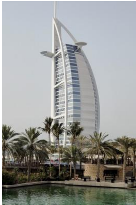
Hôtel Burj Al-Arab, Dubaï