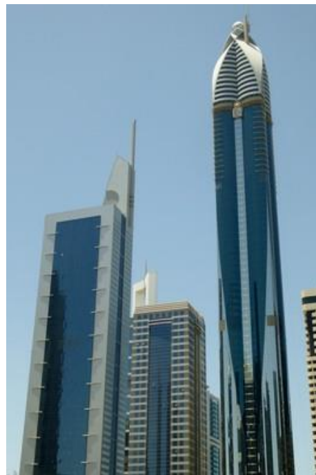
Le Burj Khalifa (828 m), Dubaï

Je prends de nombreuses photos des immeubles avant de rejoindre le Dubaï Mall, l'un des centres commerciaux gigantesques et luxueux de la ville. Toutes les marques de luxe mondiales. Des centaines de boutiques, de bars, de restaurants, un lac artificiel avec des jeux de jets d'eau, une cascade sur trois étages, un aquarium géant, une patinoire ouverte, des salles de cinéma etc. etc. C'est immense. Et quelle foule ! Pour savoir ce que veut dire « cosmopolite » il faut venir ici ! Les Emiratis sont très peu nombreux, on les reconnaît aisément : hommes en gandourah blanc immaculé, la tête recouverte d'un keffieh tenu par l'agal, une sorte de tuyau noir assez lourd. Les femmes portent l'abaya (longue robe noire), un hijab noir qui couvre la tête et le cou et quelquefois aussi un niqab qui ne laisse apparaître que leurs yeux.