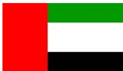
Drapeau des Emirats Arabes Unis

Bien que n'ayant pas réussi à réserver le transfert gratuit pour Dubaï sur le site défaillant d'Etihad, je trouve une place dans le bus. Départ à 8H15, bouteille d'eau fournie et autoroute presque vide à deux fois 4 voies, L'arrivée à Dubaï, à 9H30, est fascinante : tous ces beaux gratte-ciels construits dans le désert !