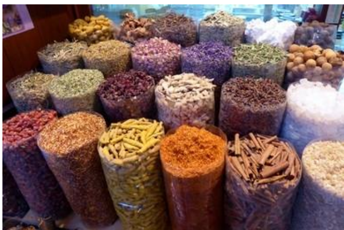
Au souk des épices, Dubaï

Petit tour enfin dans le vieux quartier de Bastakiya où les maisons sont équipées de tour à vent (climatiseurs de l'époque) mais tout a été trop parfaitement rénové, le charme évoqué dans le Lonely Planet n'agit absolument pas sur moi.