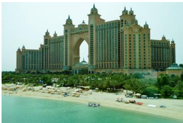
Hôtel Atlantis, Palm Jumeirah, Dubaï

Sur l'île aussi, ça construit de partout ! On ne se rend pas compte qu'elle est en forme de palmier, cela ne se peut se voir que du ciel (j'avais pris une photo en revenant du Pakistan en 2012). Le monorail me ramène sur la terre ferme.