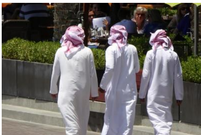
Emiratis au Dubaï Mall, Dubaï

Les ascenseurs fonctionnent, c'est une bonne nouvelle ! Un premier m'amène au 125 ème étage en 58 secondes, le second en haut où m'attend (bon, je ne suis pas seul) une équipe de serveurs : boissons et petits gâteaux à volonté. Au sommet, lorsqu'il y a du vent, ça peut giter de 2 ou 3 mètres, ce doit être impressionnant ! Et s'il arrivait ici ce qui vient de se passer au Népal ? Je préfère ne pas y penser. Cela dit, la vue panoramique est vraiment superbe et saisissante : toute cette ville dans ce désert, au bord du golfe persique. Bien en-dessous, les immeubles de 20 ou 30 étages sont tout petits ! Fascinant ! Il est déjà 17H, je redescends (en ascenseur toujours, j'ai les jambes en compote). Il me faut marcher encore un long moment par de longs tunnels vitrés équipés de tapis roulants (contrairement à ce qu'on pense, les tapis volants sont assez rares dans les pays arabes) pour rejoindre le métro. Achat d'un ticket (moins de 2 euros), foule, pas de place assise, je descends quatre stations plus loin puis quelques minutes de marche en traversant le palais des exhibitions pour rejoindre mon hôtel et ma chambre. Il est 18H. Là, travail sur mes nombreuses photos et sur mon récit, loin d'être terminé, jusqu'à 23H15.