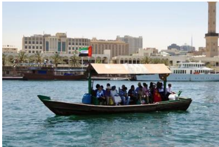
Un abra, Dubaï Creek, Dubaï

Dimanche 3 : Seconde excellente nuit, ça faisait si longtemps que cela ne m'était arrivé ! Réveil à 6H30. Travail. Beaucoup de temps consacré à mes contacts au Népal et l'organisation des aides que je finance, plusieurs heures par jour. Je ne sais pas comment je ferai dès demain au Pakistan ! Et heureusement que Facebook existe ! Il faut savoir qu'aux Emirats, à la suite des peurs des dirigeants engendrées par le Printemps arabe, il est interdit de télécharger Facebook et Twitter. Mais si on les a déjà sur ses appareils, à priori, pas de problème.