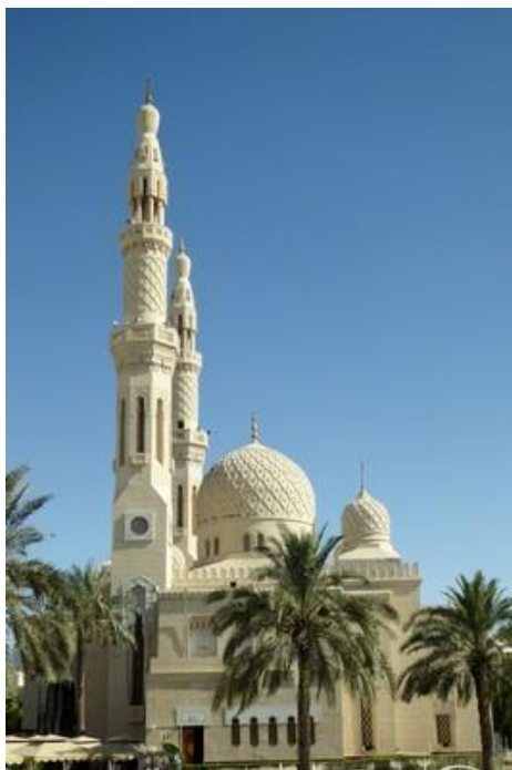
Mosquée de Jumeirah, Dubaï