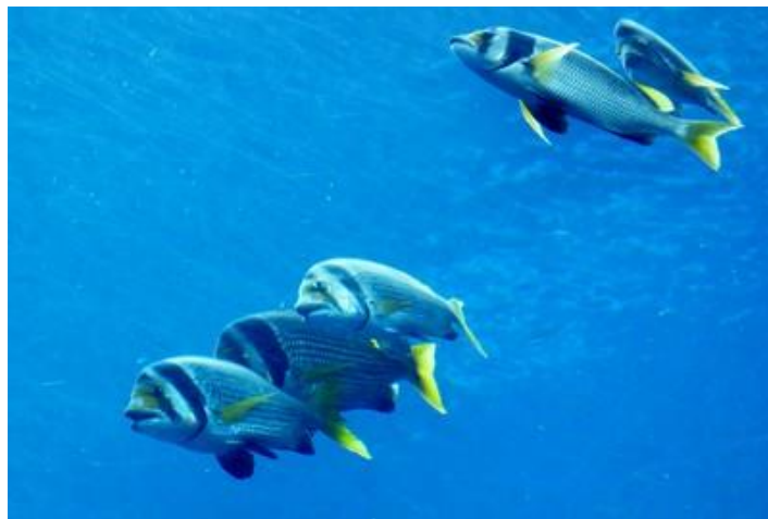
Aquarium géant de Lost Chambers, Hôtel Atlantis