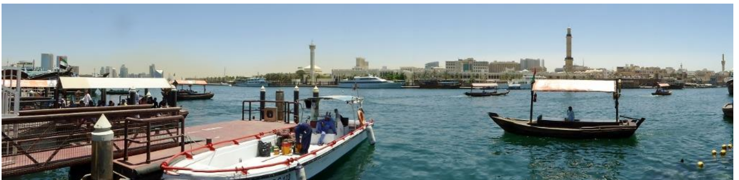
Dubaï Creek, Dubaï