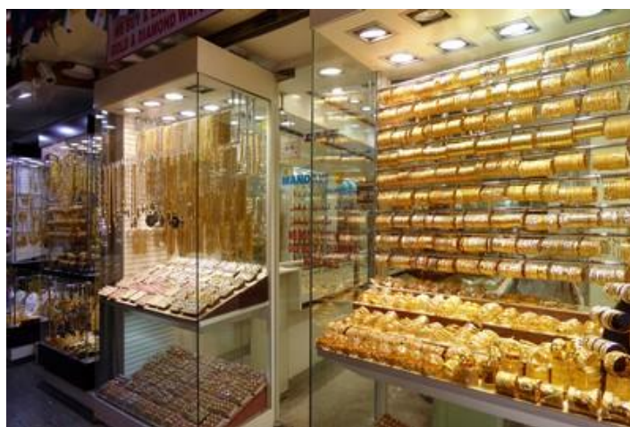
Au souk de l'or, Dubaï

Je dois demander mon chemin plusieurs fois, mon plan n'est pas bon et les rues sont souvent indiquées (ou non) par des numéros. Heureusement tout le monde ou presque parle anglais ici. Je trouve finalement l'Hindi Lane, le quartier indien où se trouvent un temple hindou (qui ferme au moment où j'arrive) et un temple sikh à l'étage au-dessus.