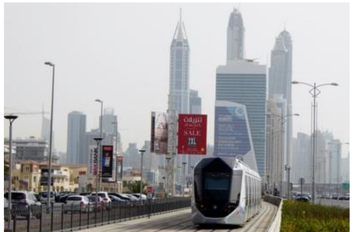
Le tramway, Dubaï