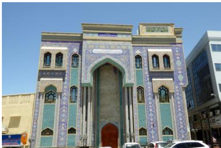
Une mosquée, Dubaï

Il fait vraiment chaud cet après-midi. Sur le chemin de la station de métro, je m'arrête chez un coiffeur pakistanais. Je comptais justement me faire coiffer là-bas, au Pakistan. Ici c'est cinq fois plus cher (5 euros), mais je me laisse tenter. A la fin, petit massage crânien bien agréable. Et ça m'a permis de prendre un peu de repos. Une bonne chose de faite ! Métro, changement de ligne à la station suivante, puis arrêt deux stations plus loin. Là, j'ai du mal à savoir quel bus prendre pour me rendre en bord de mer, à Jumeirah. Bon, je finis par trouver ! Une partie du bus, comme pour le métro, est réservé aux femmes. Je descends près du bord de mer mais la plage que je voulais voir pour avoir une idée est fermée, en pleine rénovation depuis octobre. En bordure, de très belles villas. Mais je suis surtout venu là pour la mosquée de Jumeirah : belle d'extérieur, elle est fermée au public (je le savais, elle ne se visite qu'en groupe trois fois par semaine). Un peu plus loin, une jolie mosquée iranienne et un immense hôpital iranien.