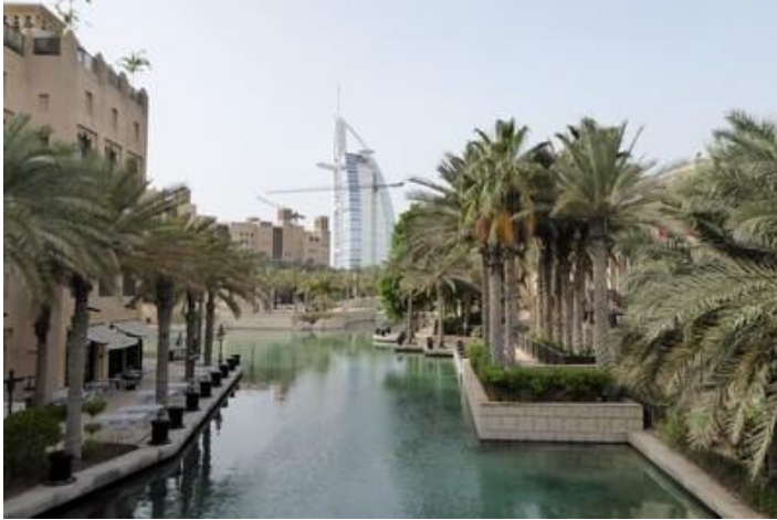
Hôtel Mina A' Salam, Madinat Jumeirah, Dubaï