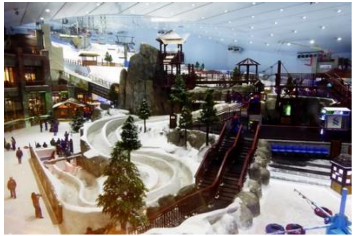
Ski Dubaï, Mall of the Emirates, Dubaï

Là aussi les couleurs françaises sont bien représentées ; la France reste une référence en matière de luxe et de qualité : vêtements, parfum, produits alimentaires. Je vois même une boutique de L'Occitane !