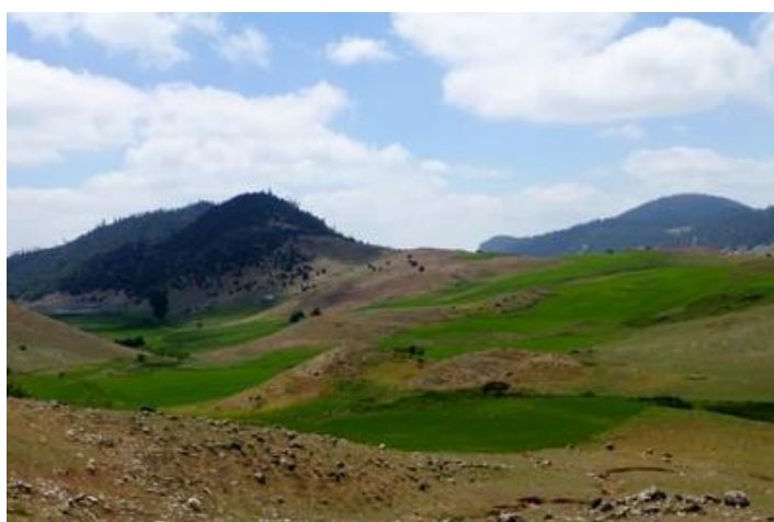
Sur la piste d'Itzer

Samedi 18 : Il pleut... J'en profite pour travailler (du retard malgré le peu de photos prises) et quitte l'hôtel un peu avant 9H. Il fait 2°. Et, sur la route qui mène à Ifrane, il commence à neiger ! Au Maroc, seconde quinzaine de mai ! Heureusement, les flocons ne tiennent pas.