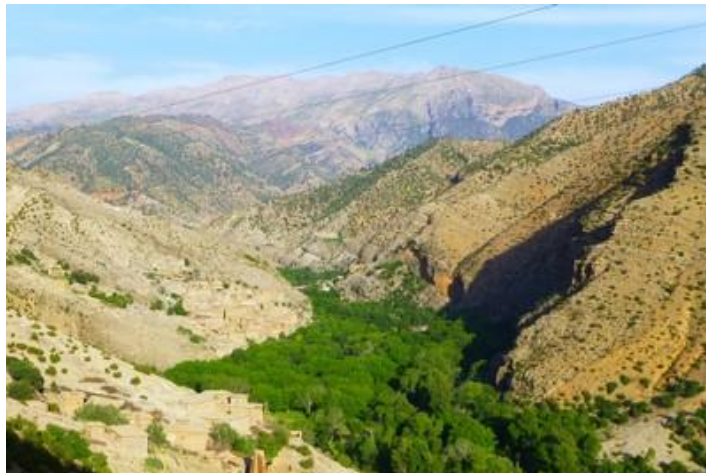
Vallée de Lakhdar, piste d'Arba à Aït-Mhammed

Jeudi 9 : Réveillé vers 5H par la mosquée du coin, je me rends. Je quitte mon hôtel à 6H30 et m'aperçois 500 m plus loin que j'ai une roue crevée, la poisse. Un clou. Arrêt à la station Shell, roue de secours. Bien sûr, à cette heure les réparateurs de pneus ne sont pas ouverts. En attendant je me rends au lac artificiel de Bin-el-Ouidane, à une vingtaine de km. Belle végétation autour de cette grande étendue d'eau.