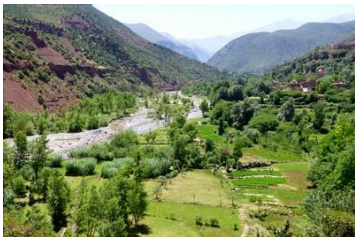
L'Ourika, vallée de l'Ourika

Je traverse ensuite Moulay-Brahim et, plus haut, le plateau de Kik pour redescendre vers la plaine et le lac de Lalla-Takerkoust. Je cherche ensuite la route d'Oumnast à Marrakech, ne la trouve pas et dois continuer jusqu'à Tahanaoute, long détour. Après 265 km, j'arrive finalement à Marrakech vers 20H et retrouve ma sœur et mon beau-frère chez eux (Ma sœur est revenue hier de France où elle avait passé une semaine). Et voilà, mon beau périple est terminé (4 147 km)