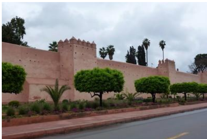
Les remparts, Marrakech