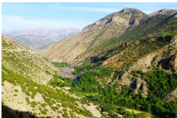
Vallée de Lakhdar, piste d'Arba à Aït-Mhammed

J'arrive une demi-heure plus tard à Azilal où je trouve facilement un hôtel d'un bon rapport qualité/prix. 308 km parcourus. Je me sens crasseux (je le suis). Pas de dîner : juste une soupe de régime. Je vais essayer en effet de faire mon régime hyper-protéiné pour le dîner et le petit déjeuner.