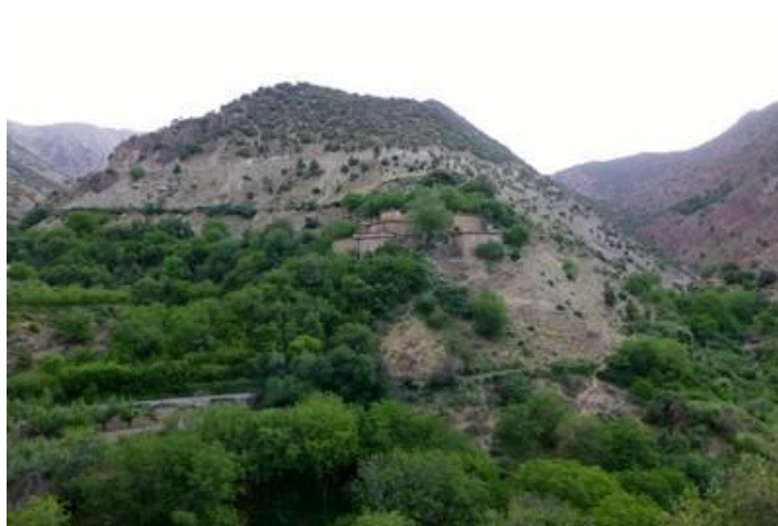
Village vers le col de Tizi-n-Test