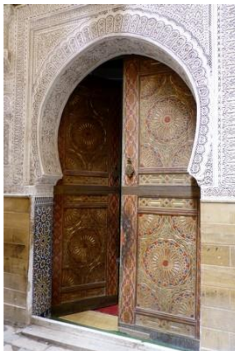
Mosquée Qaraouiyne (IX S), Fès Jeune marchand d'instruments de musique Mosquée Sidi Ahmed Tijani, Fès

Dimanche 19 : Ma chambre s'est révélée un peu bruyante, la fenêtre ferme mal et donne sur une ruelle où des enfants ont joué et crié jusqu'à minuit. Beau soleil ce matin, enfin !