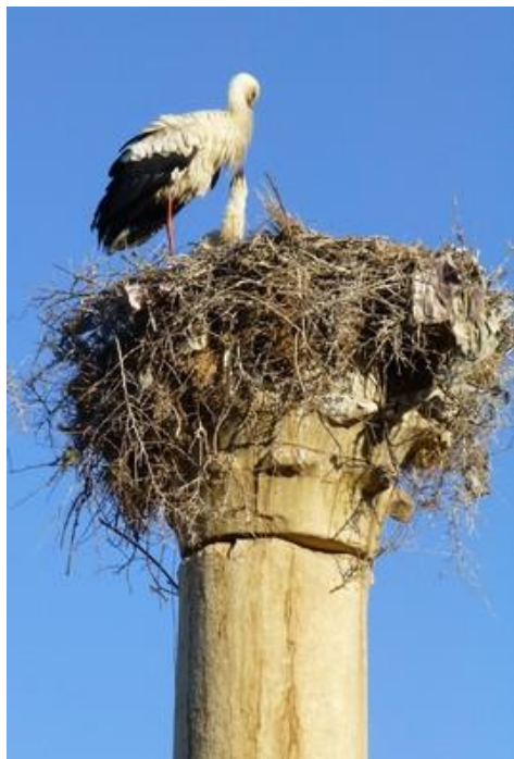
Cigogne et ses cigogneaux, Volubilis

Puis, hors de la médina, je vais découvrir le mausolée de Moulay Ismaïl, celle-ci autorisée aux non-musulmans. Je récupère ma voiture et m'arrête, dans la ville nouvelle, au Hri Moulay Ismaïl, un immense grenier à grains aux murs de 4 m d'épaisseur. A côté se trouve le grand bassin de l'Agdal, reposant. Je n'ai pas eu le temps de déjeuner, tant pis.