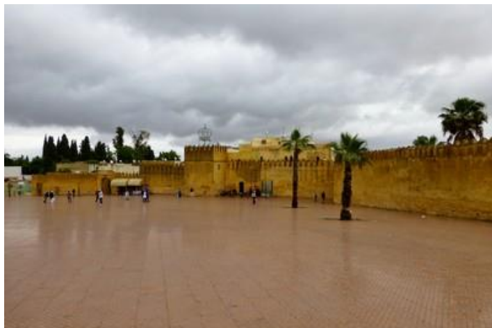
Remparts de la médina de Sefrou

Après 138 km, me voici à Fès (j'ai en effet changé mon programme, je ne vais plus à Rabat mais visiterai Fès et Meknès). Je cherche un restaurant mais ne vois que des bars, des dizaines de bars. Aucun tajine exposé à l'extérieur comme j'ai l'habitude de les voir. Tiens, je vois un Mc Do et m'y arrête, ça me change un peu.