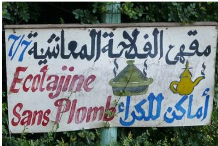
L'écotajine sans plomb !