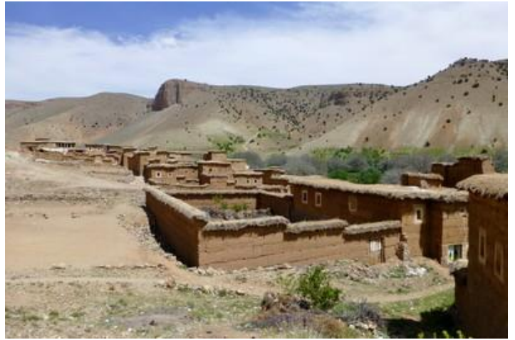
Vallée des Aït-Bougmez