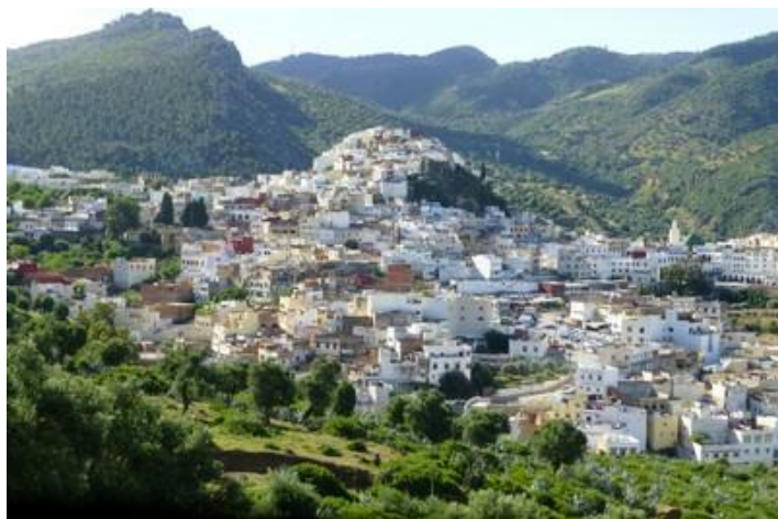
Ville sainte de Moulay-Idriss

Par Mrirt, je rejoins Khenifra à 20H30 et le même hôtel que jeudi dernier. 263 km parcourus. Enormément de monde dans les rues, comme partout au Maroc le soir, c'est impressionnant. Bon sandwich de viande de mouton, comme l'autre soir. Je me couche tard, comme toujours.