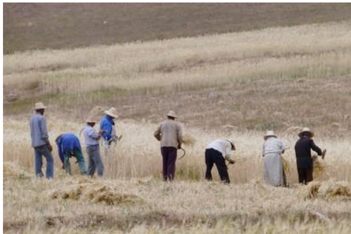
Les moissons, plateau de Kik

Mercredi 15 : Temps gris. Je travaille au petit matin en attendant que mon beau-frère, gros dormeur, se lève. Nous avons convenu qu'il jetterait un coup d'œil à ma voiture, qui fait un peu de bruit à basse vitesse (un boulon desserré ?). Il ne trouve rien et me conseille de joindre le loueur, ce que je fais. Ce dernier me propose gentiment de me changer la voiture. Je pars donc au centre de Marrakech et récupère une autre voiture, la même Hyundai 10, cette fois gris foncé. Et, cette fois, la climatisation semble marcher convenablement. Il est midi.