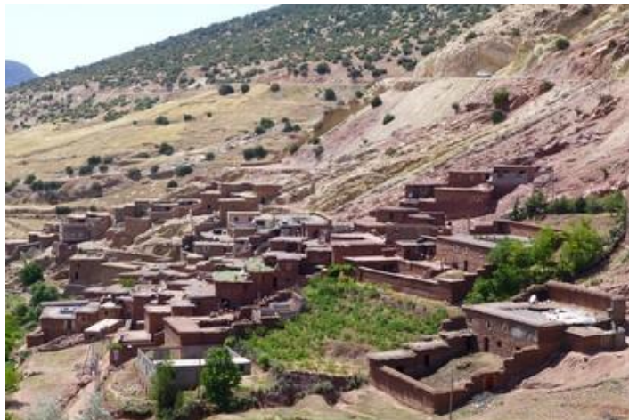
Sur la route entre Aghbalou et Asni