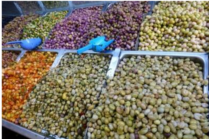
Les olives, dans le souk

Puis je mets un moment à trouver l'hôtel où j'ai réservé une chambre ce matin ; il me faut demander plusieurs fois mon chemin. M'y voici enfin, au nord-est de la médina. Chambre correcte pour un prix raisonnable. Quelques rayons de soleil. Je pars aussitôt (re)visiter la médina (je l'avais déjà visité il y a une vingtaine d'année, tout comme Meknès et le reste de la région).