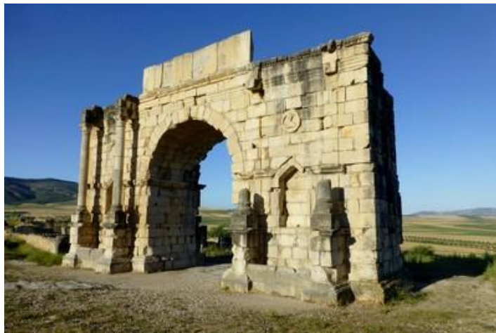
L'arc de triomphe, Volubilis

Me voici à Meknès en milieu de matinée. Ville à priori créée au X ème siècle, elle a aujourd'hui près de 600 000 habitants mais est bien plus plaisante (et moins touristique) que Fès, qui ne se trouve qu'à une cinquantaine de km.