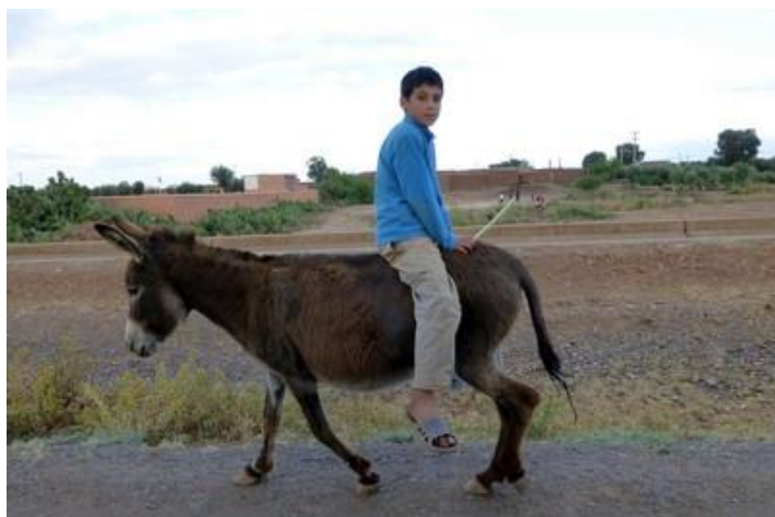
A califourchon, vers Attouïa-Ech-Chebiya

Comme il ne fait pas beau, je décide de ne pas prendre mon jour de repos prévu et de repartir de suite vers le nord. Je passe par Sidi-Rahal (où des enfants lancent des pierres sur la voiture à mon passage, ce qui arrive trop souvent au Maroc), puis par Attaïa-Ech-Chebiya et Khemis-Madjen. Chemins de traverse, toujours, lorsque cela est possible. Je m'arrête finalement à la nuit, après 200 km pile, à l'hôtel d'Azilal où j'ai déjà dormi la semaine dernière.