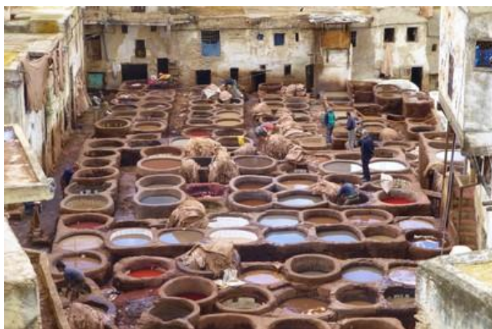
Aux tanneries Chouara, médina de Fès

Fès, cité impériale et capitale culturelle du Maroc, est une ville de plus d'un million d'habitants, assez compliquée, avec trois parties importantes : Fès la moderne (datant du protectorat français), Fès-el-Jedid (Fès la nouvelle, du XIIIème siècle), Fès-el-Bali (Fès la vieille, du VIIIème siècle). Fès était une ville richissime, les Fassis (à ne pas confondre avec Farsy) étant des hommes d'affaires redoutables. Mais, à l'indépendance du Maroc, 95 % de cette population (250 000 habitants à l'époque) a quitté la ville pour aller vivre à Casablanca, Rabat, la France, le reste de l'Europe de l'ouest ou l'Amérique du nord, délaissant leur palais ou magnifiques demeures. De pauvres paysans, attirés par les lumières de la ville, sont venus les remplacer. Du coup, plus rien n'a été entretenu et la ville s'est dégradée jusqu'à que l'Unesco réagisse. Aujourd'hui, heureusement, des travaux de réhabilitation ont lieu un peu partout pour préserver ce superbe patrimoine.