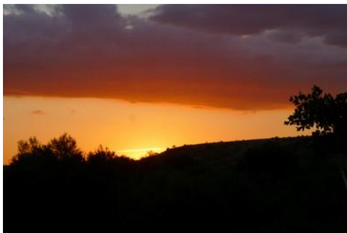
Coucher de soleil, Tannant

Jeudi 16 : Eu froid cette nuit malgré ma couverture (environ 10°). Il pleuviote, et cela durera toute la matinée. La météo n'est pas bonne pour les prochains jours. Brouillard à couper au couteau sur les hauteurs.