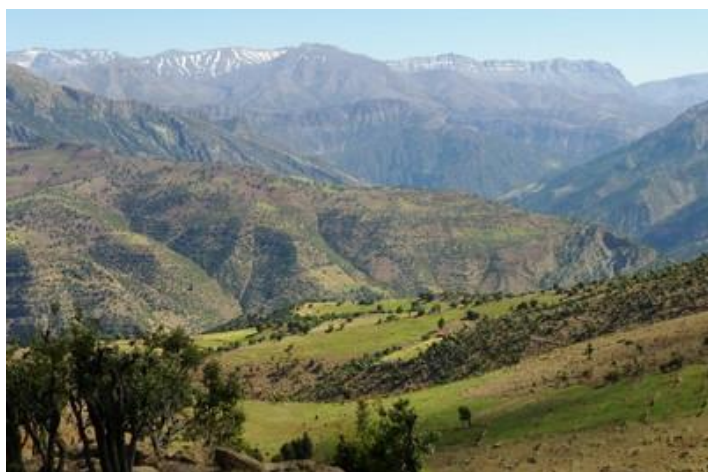
Entre Aït Mhammed et Agouti