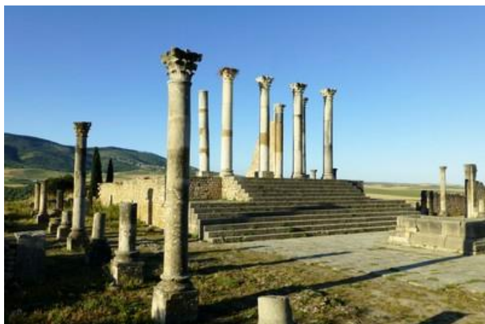
Le forum, Volubilis

Retour au gîte où un copieux petit-déjeuner m'attend. Je pars ensuite pour Meknès, en faisant un arrêt à Moulay-Idriss, la ville sainte du Maroc, construite en étages sur deux collines. Les maisons sont toutes blanches et l'ensemble est superbe. Dans la médina montent des ruelles tortueuses. Le mausolée est bien sûr interdit aux non-musulmans. Moulay Idriss, fondateur de la ville de Fès, était l'arrière-petit-fils du prophète Mahomet.