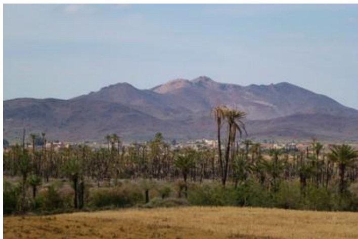
La chaîne du Haut Atlas, Marrakech

Je rejoins alors, difficilement dans la nuit, la maison de ma sœur, dans la palmeraie. Elle, son conjoint et leurs deux amis, tous arrivés deux heures avant moi, terminent leur repas. Je dîne donc en vitesse puis nous discutons un moment avant de nous coucher vers minuit et demi (moi dans ma chambre habituelle)