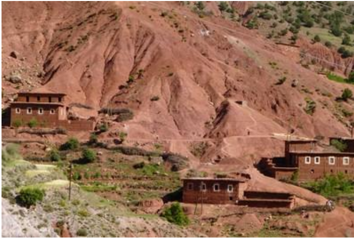
Vers la vallée des Aït-Bougmez