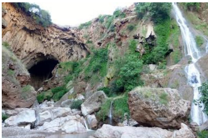
Pont naturel d'Imni n'Ifri

Sur la route de Marrakech, je bifurque par Zarouiet puis, plus loin, me rends jusqu'à Tidili-des-Mesfioua. Je ne connaissais pas encore ce village en cul-de-sac. La nuit ne va pas tarder à tomber, pas le temps de rentrer à Marrakech, à 60 km. Après 238 km, je m'arrête à un hôtel confortable et peu onéreux sur le bord de la route, au sud d'Aït-Ouirir.