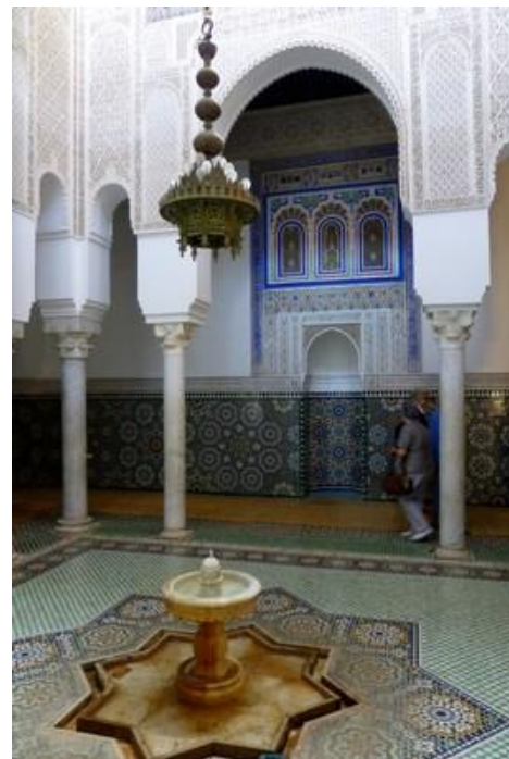
Mausolée de Moulay Ismaïl (1703)

Le ciel s'est rempli cet après-midi de gros nuages, mais il ne pleuvra pas. Je n'aurai pas le temps d'aller à Rabat comme je l'avais prévu initialement. Ce n'est pas grave, ce sera pour une autre fois.