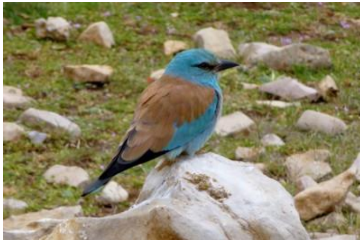
Bel oiseau près d'un lac

Vendredi 17 : Il fait froid. Un panneau lumineux affiche 3° lorsque je reprends la route à 7H. Ciel gris et léger brouillard qui se dissipera rapidement. Mais il ne pleuvra pas aujourd'hui.