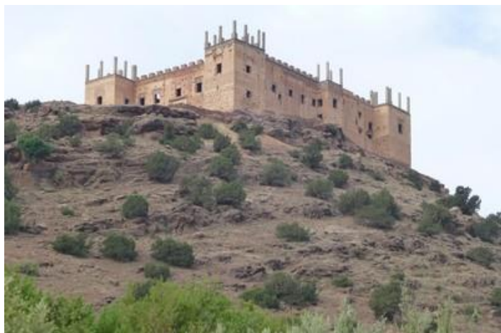
Vieille mosquée de Tinmel (XII S)