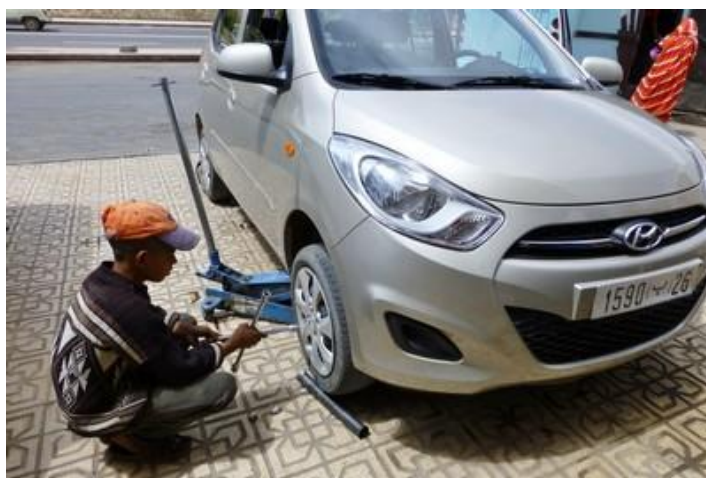
Un apprenti change ma roue crevée, Taliouine

Lundi 13 : Excellente nuit, mais je sens que je me fais vieux... Je travaille encore une heure et demie avant de partir. Du coup, je ne quitte l'hôtel qu'à 8H30, c'est tard.