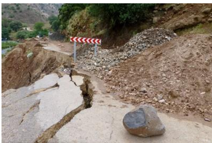
Route effondrée, vers les sources de l'Oum-er-Rbia

Azrou est une ville de 50 000 habitants située à 1 200 m d'altitude. Hôtel au centre, chambre petite et sommaire, douche et WC communs.