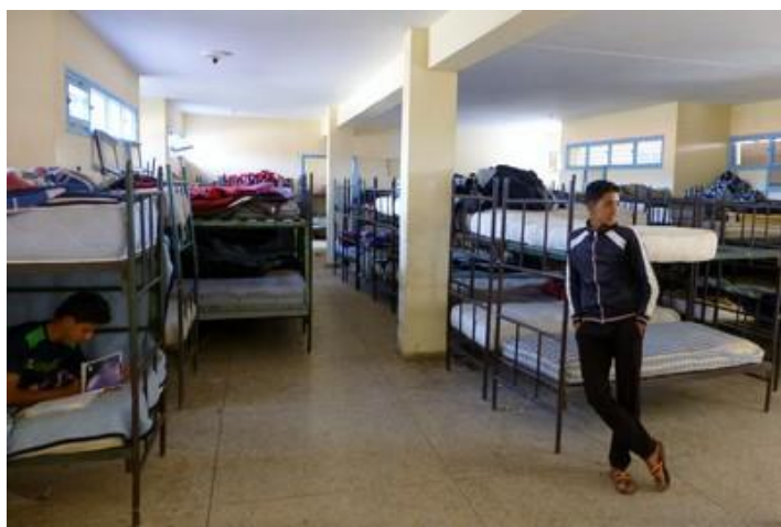
Dortoir de l'internat du lycée de Taliouine

Je travaille jusqu'à minuit (je n'ai pu travailler hier soir). Le forfait Internet illimité marocain de mon iPhone me permet une connexion partagée avec l'ordinateur, ça marche plutôt bien et c'est très pratique.