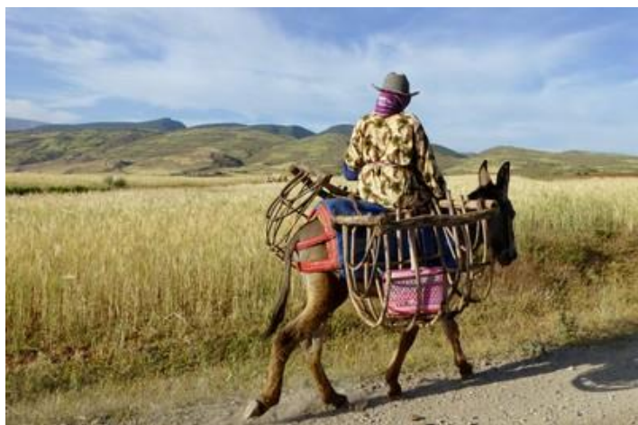
L'âne, la femme et les paniers...

A Agouim, je prends une route récemment goudronnée jusqu'à Tiourar, au sud-ouest. Puis c'est une bonne piste. Je remonte jusqu'à Imil mais il est trop tard pour me rendre au lac d'Ikni, à une heure de marche. Je laisse tomber, ce sera peut-être pour une autre fois.