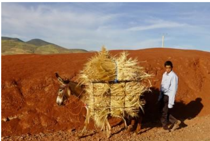
Ane et moisson, vers Demnate

Samedi 11 : Je suis prêt dès 7H mais doit attendre un quart d'heure que l'hôtel-restaurant ouvre ses portes. Je monte un peu vers le col et croise une file impressionnante de véhicules officiels venant sans doute de Ouarzazate : au moins deux cents grosses Peugeot noires de la Sûreté Nationale, une bonne cinquantaine de Mercedes noires intercalées, des véhicules de l'armée, une vingtaine d'ambulances, de grosses dépanneuses et même des camping-cars très larges, comme je n'en ai jamais vu. C'est impressionnant !