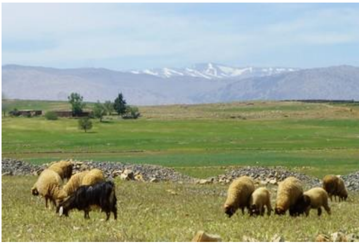
Moutons et chèvre, vers Aït-Mhammed