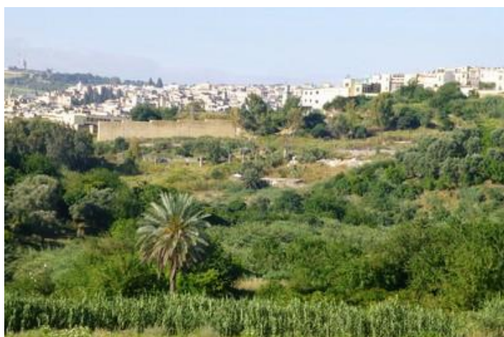
Vue sur Fès

Après 358 km, j'arrive finalement vers 21H15 à Volubilis, où je trouve une chambre dans un gîte. Journée fatigante et un peu décevante.