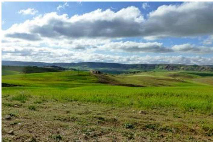
Paysage vers Aghbala

Ma chambre est correcte mais la fenêtre donne sur un patio intérieur ; je n'aime pas cela, c'est souvent bruyant, mais je n'ai pas le choix. Douche (chaude), mais pas de WC, il se trouve sur le palier, pas très pratique. Ce soir il fait très froid, je suis plus prévoyant qu'hier et mets une seconde couverture sur mon lit.