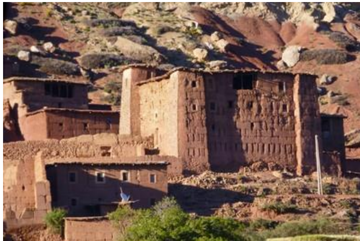
Sur la piste d'Agouti à Demnate

Mercredi 22 : Réveillé dès 6H (je comptais pourtant bien dormir un peu plus). Eu un peu froid malgré mes deux couvertures. Très beau temps, vent léger. Ça doit se réchauffer un peu : il est annoncé 25° sur Marrakech, 10° de moins toutefois que la semaine dernière.