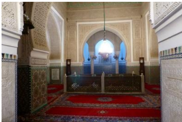
Mausolée de Moulay Ismaïl (1703), médina de Meknès

Mardi 21 : Ciel très chargé, il a dû pleuvoir cette nuit, ma voiture est mouillée. Départ vers TH, toujours vers le sud-ouest. Route de Kasba Tadla, traversée de Ben-Mellal, toujours aussi encombrée. C'est une grosse ville sans grand intérêt. Plus loin je bifurque à gauche vers Ouzoud. Je ne connais pas cette route, elle doit être récente, toujours marquée comme piste sur la très mauvaise carte Michelin de 2012. Je commence à retrouver mes paysages de l'Atlas que j'aime tant : les montagnes ocre, les champs verts, les maisons de terre.