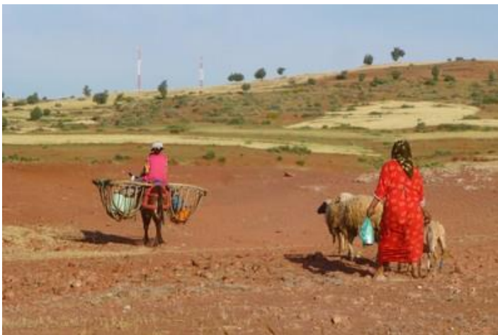
Femmes, vers Demnate

Bon, je déjeune d'un quart de poulet accompagné de frites.