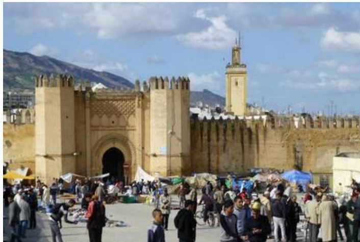
Bâb Chorfa, médina de Fès

La médina de Fès est entourée de remparts, on y pénètre par l'une des 14 portes monumentales (bâb). Je ne peux vous citer tout ce que j'ai vu, juste quelques exemples.