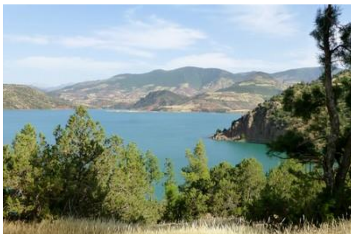
Lac de Moulay Youssef