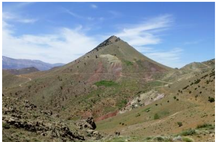
Vers le Tizi-n'Irhi