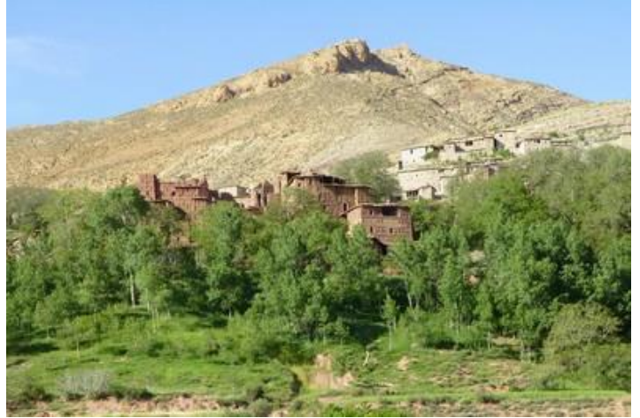
Village, sur la piste allant à Demnate

Vendredi 10 : La nuit incluant le petit-déjeuner, j'en profite dès 6H30. Une demi-heure plus tard, me voici parti sur la route de Ouarzazate à la recherche de la piste passant près de la montagne de l'Iskt et par le col de Tizi-Ouadakeur. Je tourne et vire, fait 70 km et finit par trouver une piste exécrable et caillouteuse. Avant, je me suis renseigné à trois reprises, avis contraires. Une fois engagé sur cette piste impossible de faire demi-tour.