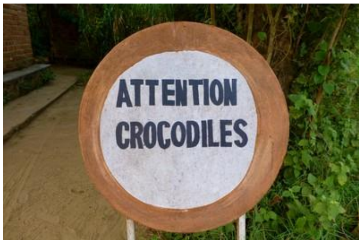
Attention aux crocodiles !

paraît-il, au courant). Je souhaite ensuite un bon voyage à mes trois compagnons qui partent à l'aéroport et s'envoleront vers la France en début d'après-midi. Ils étaient encore une fois bien sympas (de m'avoir supporté, surtout).