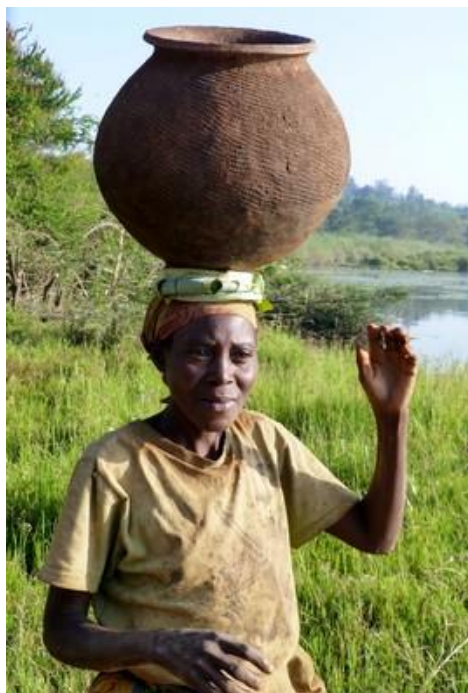
Femme au pot, lac Rwihinda, Kirundo

Trop court à mon goût, comme tout ce qui est bon. Retour à Kirundo et arrêt à la poste, où il y a foule, pour acheter des timbres. Mais, au Burundi, les timbres ne peuvent pas être emportés et doivent être apposés sur place sur le courrier. Curieux. Comment font donc les collectionneurs (s'il y en a) ? Finalement la postière, après avoir téléphoné pour avoir l'aval d'un chef quelconque, consent à nous vendre quelques timbres (il en faut 6 pour une carte postale !). Nous repartons alors par une très bonne route jusqu'à Muyinga, à 70 km environ au sud-est. Comme toujours, beaucoup de gens marchent sur la route. Nombreux cyclistes aussi (la grande majorité des vélos sont identiques, fabriqués en Chine). Muyinga est une ville quelconque de 20 000 habitants, à 1731 m d'altitude. Nous y arrivons vers midi et continuons par une abominable et très poussiéreuse piste en réfection, qui va être transformée en route à double-voie, jusqu'à Gasave, l'entrée nord du parc national de la Ruvubu. Ces travaux sont en tout cas une grande attraction pour la population locale.