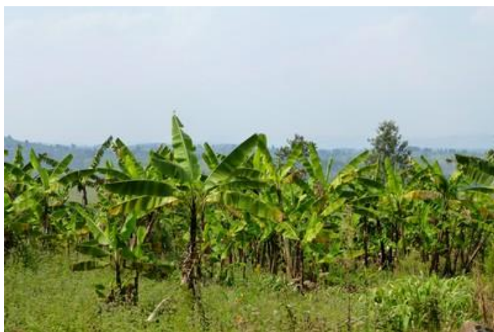
Plantation de bananiers, piste de Songa

Revenu sur la nationale, un peu plus loin, à Muyagoro, je reprends une mauvaise piste de 12 km jusqu'à Kiryama, où j'arrive à 12H45. Là, je m'arrête dans un petit restaurant qui sert un seul plat, le plat typique du pays : du riz, des haricots noirs, du chou et des bananes-légumes. Ce n'est pas mauvais, sans plus. Mais ça fait du bien, je n'avais presque rien mangé depuis l'avant-veille. Mon assiette, copieuse, me coûte 0,25 euro alors que ma bouteille d'eau d'1,5 l en vaut 0,60. Je traverse la nationale et, plutôt que de me rendre directement à Rumonge, sur la lac Tanganyika, je reprends une piste vers le nord-ouest. Elle se révèle très difficile mais les paysages sont superbes. Plantations de bananes et petits villages se succèdent. Les maisons sont typiques, comme celle que nous avons visitée mercredi : clôtures de bambous ou branchages, toits de paille, etc. Chaque village a son immense église catholique de briques. Des hommes marchent sur la route ou sont assis dans les villages, leur long bâton dans la main (signe qu'il possède du bétail). Je passe Songa, continue tant bien que mal, suis obligé de me mettre en 4 roues motrices sur quelques mètres, passe des ponts bancals, évite des ornières très profondes. Après trente km éprouvants, j'arrive à Muzenga à 17H, ce qui fait du 10 km/h.