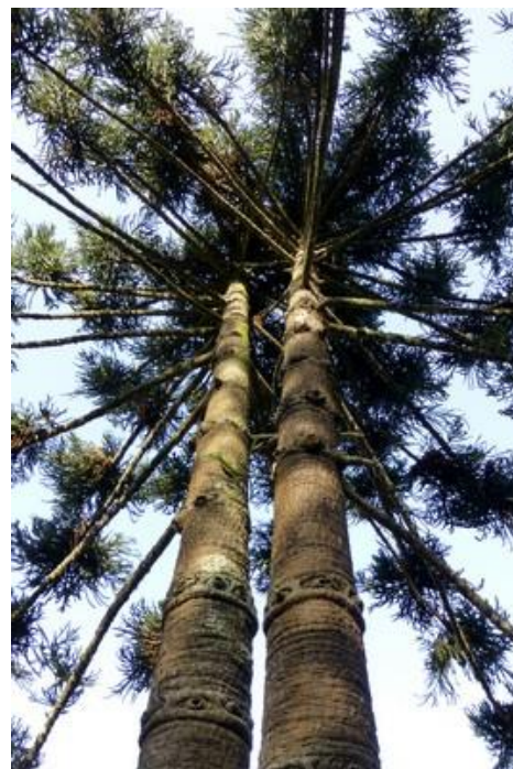
Avec un pygmée batwa, village de Busekera Vieil homme batwa, Busekera Arbres jumeaux, Ngozi