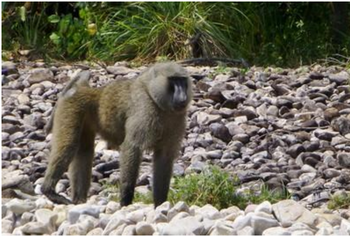
Babouin, lac Tanganyika, Tanzanie