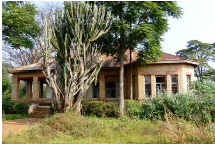
Le palais royal, Gitega

Dimanche 9 : Malgré mes boules Quiès, beaucoup de bruit cette nuit, peut-être parce que c'est le week-end. Réveillé, je me lève vers 5H30. Seules 6 sur 11 de mes vidéos ont pu être mises en ligne durant la nuit, zut. Nous quittons l'hôtel à 6H30, prenons le petit-déjeuner ailleurs puis roulons vers le sud sur une très bonne route pendant 51 km. Je demande à Louis, qui depuis le début du voyage n'a toujours pas nettoyé son véhicule, d'au moins laver le pare-brise, ce qu'il fait avec les essuie-glaces. Temps superbe, ciel bleu magnifique. Au sud de Ngoma, nous prenons une mauvaise piste sur la gauche, donc vers l'est, jusqu'à Kayero où nous bifurquons au sud jusqu'à Nyakazu. Beaucoup de monde à pied ou à bicyclette sur la piste, surtout vers Shanga où se tient un grand marché et vers les villages où les églises sont pleines. D'ailleurs la plupart des habitants sont mieux habillés que d'habitude : robes très colorées des femmes et même des hommes en veston ! Le long de la piste, plantations de sorgho, d'ananas et de caféiers. Des sacs de charbon de bois, très haut, attendent des acheteurs. A ce sujet, le déboisement s'accroît au Burundi, c'est un vrai problème. Nous croisons aussi de petits troupeaux de vaches maigres aux énormes cornes, de moutons et de chèvres. Nous arrivons enfin vers 11H à la faille des Allemands, près de Nyakazu, à 1950 m d'altitude.