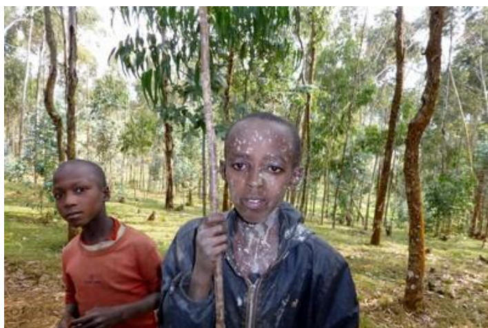
Jeunes bergers, vers Gatwa