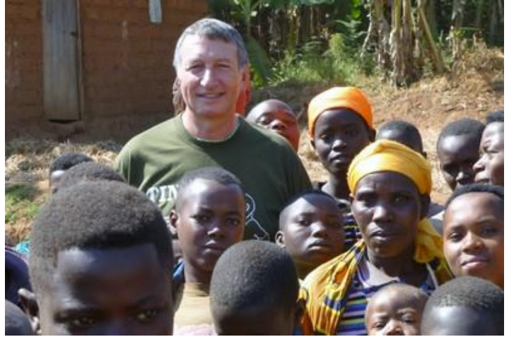
En noir et blanc, Kirundo

Samedi 8 : J'aurais pu faire la grasse matinée jusqu'à 7H, mais le muezzin, l'enfoiré (et je pèse mes mots), me tire de mon sommeil vers 5H, réveillant aussi des corbeaux qui courent sur le toit de mon bungalow en faisant un raffut pas possible. Bien que fatigué, je me lève donc, que faire d'autre ? Ce qui me permet de mettre à jour mon site. Petit-déjeuner copieux (grosse omelette) et départ à 8H. Pratiquement aucun véhicule dans les rues : partout au Burundi, tous les samedis, de 6 à 10H, les automobilistes n'ont pas le droit de circuler et la police veille. Et pourquoi cela, me direz-vous ? Bonne question. Eh bien, ce sont les horaires du travail communautaire obligatoire pour tous, hommes, femmes, enfants : nettoyage des rues, construction d'écoles, déblayage des caniveaux et toutes sortes d'autres travaux. Cela paraît plutôt bien, mais environ 70 % des familles pensent que cela a été récupéré par le parti politique au pouvoir et refuse de l'accomplir. Mais que fait la police ? (ah ah ah). En effet, beaucoup de personnes discutent en petit groupe, font leurs achats, se déplacent en vélo, des enfants jouent au ballon etc... Les établissements scolaires sont fermés le week-end. Eddy m'explique que les autres jours les écoliers ont cours de 7H30 à 11H30 et de 12H30 à 17H30 (ça me semble beaucoup), et les collégiens et lycéens de 7H30 à 13H. Excellente route vers le sud-ouest sur 93 km jusqu'à Gitega. Petit arrêt en cours de route après avoir traversé la Ruvubu vers Rugajo.