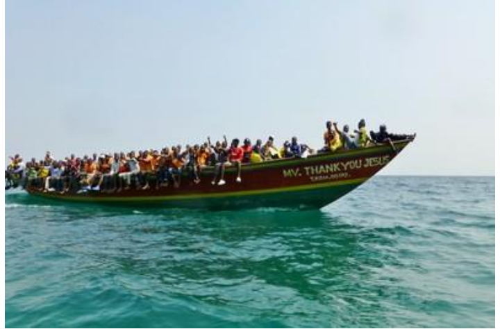
Transport en commun sur lac Tanganyika, Tanzanie