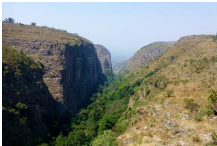
La faille des Allemands, Nyakazu

Cette faille d'origine tectonique fréquente s'ouvre sur la dépression du Kumoso, une entaille dans le massif de Nkoma qui surplombe de 700 m la plaine et se prolonge à la frontière avec la Tanzanie. Une chute d'eau d'une hauteur de plus de 100 m se déverse dans la faille où les arbres abondent. Plus loin, vestiges historiques d'un fort allemand où se rendent mes compagnons tandis que j'essaie d'enlever les centaines d'herbes piquantes coincées dans mes chaussures et chaussettes. C'est très ch.... Vers midi, nous repartons en sens inverse sur la mauvaise piste, direction Shanga. Là-bas, deux heures plus tard, quelques photos du marché depuis le véhicule (puisque c'est interdit). Je commence à avoir vraiment très faim. A priori, ne rien faire creuse... Enfin, à 14H30 nous voici aux chutes de Karera, réparties sur trois paliers. D'abord, c'est urgent, le pique-nique, devant une belle chute d'environ 80 m qui se déverse dans un bassin. En apéritif, une liqueur d'ananas achetée hier, c'est bon. Puis les deux petits sandwiches sans beurre sont un peu secs (la chaleur), mais la salade de fruits, copieuse, est délicieuse. Mais j'ai encore faim et il n'y a plus rien... Nous partons ensuite nous balader plus bas,