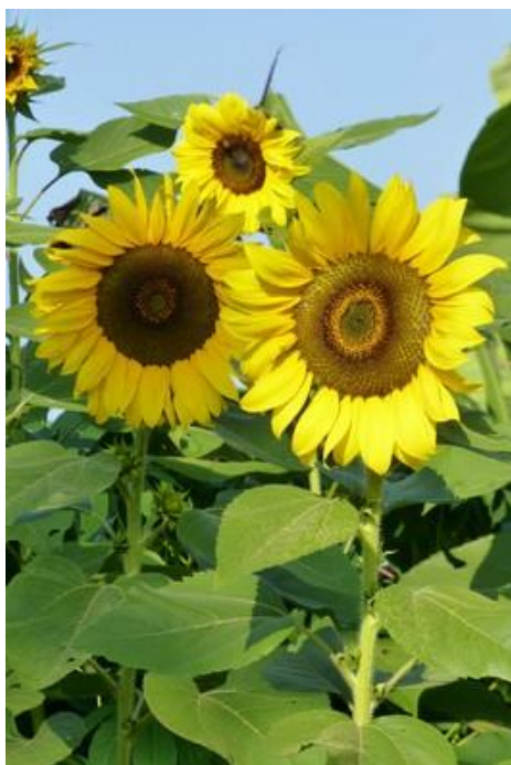
Tournesols, près du lac Rwihinda