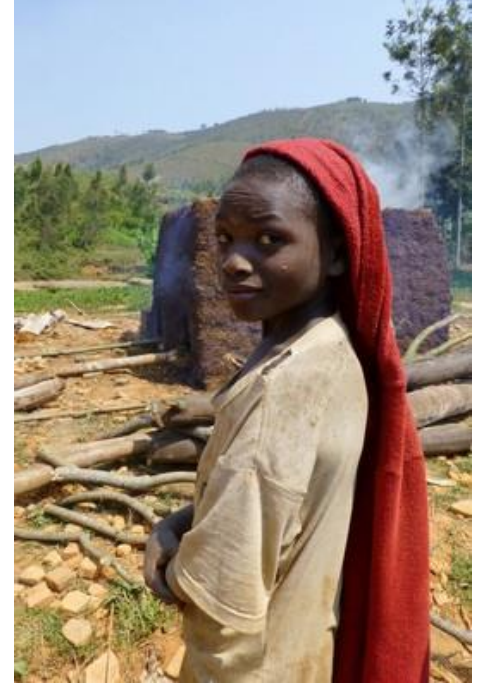
Encore quelques portraits...