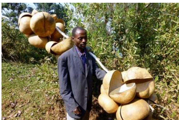
Marchand de calebasses, Shanga

Dimanche 9 : Malgré mes boules Quiès, beaucoup de bruit cette nuit, peut-être parce que c'est le week-end. Réveillé, je me lève vers 5H30. Seules 6 sur 11 de mes vidéos ont pu être mises en ligne durant la nuit, zut. Nous quittons l'hôtel à 6H30, prenons le petit-déjeuner ailleurs puis roulons vers le sud sur une très bonne route pendant 51 km. Je demande à Louis, qui depuis le début du voyage n'a toujours pas nettoyé son véhicule, d'au moins laver le pare-brise, ce qu'il fait avec les essuie-glaces. Temps superbe, ciel bleu magnifique. Au sud de Ngoma, nous prenons une mauvaise piste sur la gauche, donc vers l'est, jusqu'à Kayero où nous bifurquons au sud jusqu'à Nyakazu. Beaucoup de monde à pied ou à bicyclette sur la piste, surtout vers Shanga où se tient un grand marché et vers les villages où les églises sont pleines. D'ailleurs la plupart des habitants sont mieux habillés que d'habitude : robes très colorées des femmes et même des hommes en veston ! Le long de la piste, plantations de sorgho, d'ananas et de caféiers. Des sacs de charbon de bois, très haut, attendent des acheteurs. A ce sujet, le déboisement s'accroît au Burundi, c'est un vrai problème. Nous croisons aussi de petits troupeaux de vaches maigres aux énormes cornes, de moutons et de chèvres. Nous arrivons enfin vers 11H à la faille des Allemands, près de Nyakazu, à 1950 m d'altitude.