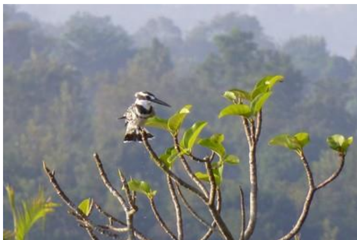
Martin-pêcheur, lac Rwihinda, Kirundo

Arrêt dans un petit village afin d'assister à un spectacle de danseurs-guerriers Intore. Ceux-ci sont en tenue traditionnelle (pagne en peau de léopard, torse et pieds nus, crinière en fibres de sisal sur la tête, grelots aux chevilles...) et dansent formidablement bien, accompagnés de quatre musiciens (tam-tams et flute). Le spectacle est aussi tout autour de nous : les habitants du village, dont de nombreux enfants, ont l'air aussi heureux que nous de voir ce spectacle. Un vrai régal !