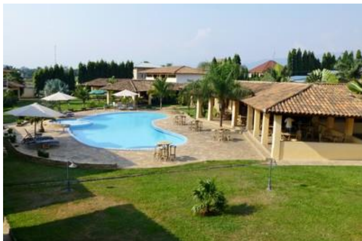
Mon hôtel, La Palmeraie, Bujumbura