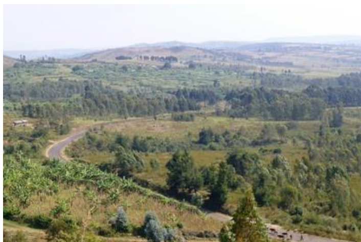
Paysage autour de la source du Nil Blanc

Notre Toyota nous dépose ensuite plus loin, à 6 km. Petite balade de 45 minutes jusqu'à la source chaude de Muhwesa où de jeunes garçons se baignent nus. Mais pas nous... L'endroit, au pied du massif de Kibimbi (2367 m), est magnifique. Nous en repartons vers midi, demi-tour jusqu'à Rutana. Petit arrêt en route pour regarder la fabrication de briques. Celles-ci sont ensuite transportées au bord de la route en bicyclette (au moins 200 par vélo !). A Rutana, nous accompagnons Martin au marché pour acheter du tissu. Marché tristounet, presque toutes les boutiques sont fermées. Il est déjà 13H30 et je pensais que nous déjeunerions ici, mais non, il nous faut continuer par une bonne route vallonnée et aux nombreux virages jusqu'à Makamba, à 51 km. Enfin, à 14H30, nous sommes attablés devant de copieuses assiettes : morceau de viande de bœuf, petits pois, riz, frites et autres légumes. Très bon. Après le déjeuner, un groupe d'une quinzaine de danseurs Agasimbo (danseurs-toupie), dont un enfant, nous font une démonstration de leurs talents durant 20 minutes en exécutant des danses acrobatiques tout en chantant et frappant dans les mains, les seuls instruments de musique étant les grelots à leurs chevilles. C'est sympa et les enfants du village, qui nous avaient accueillis avec des « Umuzungu, umuzungu » (le Blanc, le Blanc), sont ravis.