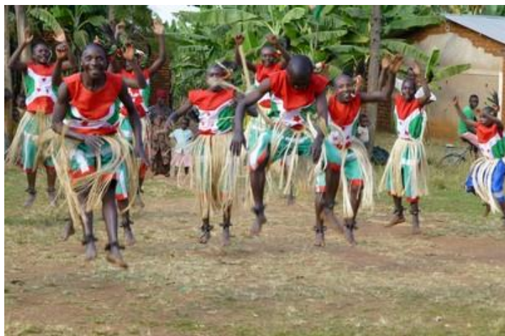
Danseurs Agasimbo, Makamba