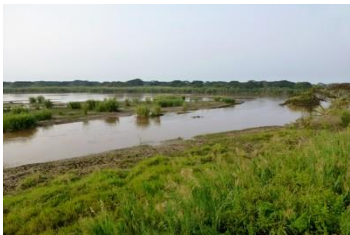
Parc naturel de la Rusizi