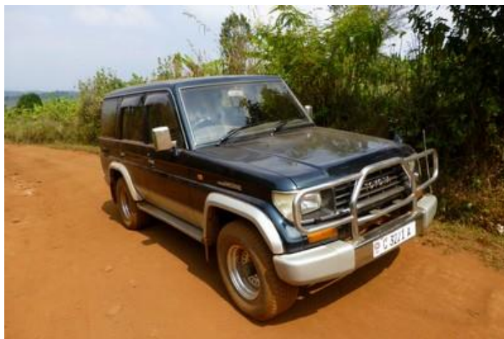
Mon Toyota Prado

Revenu sur la nationale, un peu plus loin, à Muyagoro, je reprends une mauvaise piste de 12 km jusqu'à Kiryama, où j'arrive à 12H45. Là, je m'arrête dans un petit restaurant qui sert un seul plat, le plat typique du pays : du riz, des haricots noirs, du chou et des bananes-légumes. Ce n'est pas mauvais, sans plus. Mais ça fait du bien, je n'avais presque rien mangé depuis l'avant-veille. Mon assiette, copieuse, me coûte 0,25 euro alors que ma bouteille d'eau d'1,5 l en vaut 0,60. Je traverse la nationale et, plutôt que de me rendre directement à Rumonge, sur la lac Tanganyika, je reprends une piste vers le nord-ouest. Elle se révèle très difficile mais les paysages sont superbes. Plantations de bananes et petits villages se succèdent. Les maisons sont typiques, comme celle que nous avons visitée mercredi : clôtures de bambous ou branchages, toits de paille, etc. Chaque village a son immense église catholique de briques. Des hommes marchent sur la route ou sont assis dans les villages, leur long bâton dans la main (signe qu'il possède du bétail). Je passe Songa, continue tant bien que mal, suis obligé de me mettre en 4 roues motrices sur quelques mètres, passe des ponts bancals, évite des ornières très profondes. Après trente km éprouvants, j'arrive à Muzenga à 17H, ce qui fait du 10 km/h.