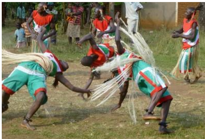
Danseurs Agasimbo, Makamba