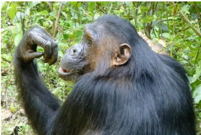
Guenon chimpanzé, parc de la Gombé, Tanzanie