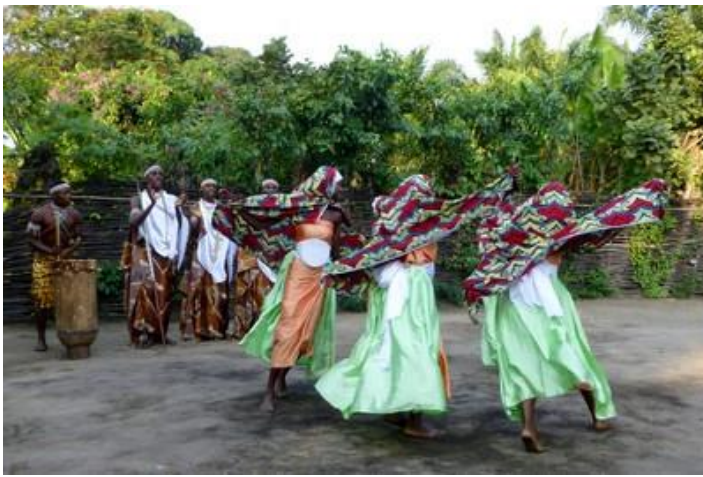
Les danseuses, Musée Vivant, Bujumbura