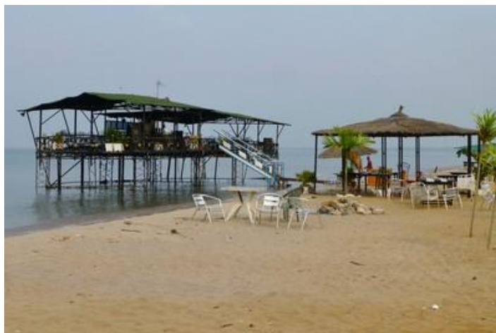
Plage nord de Bujumbura