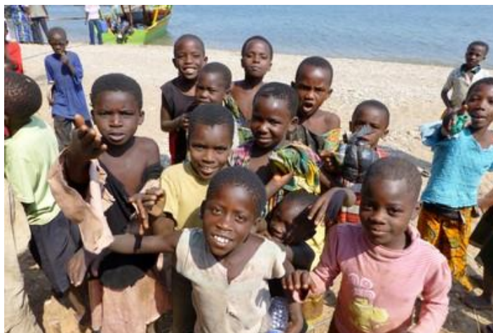
Enfants tanzaniens, lac Tanganyika

Au bout d'une heure, nous arrivons aux postes frontières. Débarquement au poste d'immigration du Burundi, puis à celui de la Tanzanie où les formalités sont plus longues. Il faut en effet y régler un visa de 50 US$, un visa qui n'est en fait qu'un coup de tampon sur le passeport. A peine repartis, nous tombons en panne de moteur et rejoignons la côte à la rame. Nous débarquons une troisième fois et, en attendant qu'un mécanicien répare, nous baladons une bonne heure dans un village de pêcheurs tanzaniens où les enfants sont légion. L'ambiance est très sympathique, il aurait été dommage de ne pas s'arrêter. Finalement, comme c'est trop long, notre pilote loue un autre moteur et nous repartons vers 10H30, accompagnés du mécanicien, au cas où... Bien vu, nous retombons en panne une heure plus tard et, en mer, le mécanicien démonte le moteur pour s'apercevoir, finalement, au bout d'une demi-heure, qu'il est alimenté par un bidon de gazole au lieu d'essence (parce que c'est moins cher ? Il faut le faire, quand même !). Comme nous avons pris du retard nous commençons à pique-niquer dans le bateau (deux petits sandwiches) et finissons par une bonne salade de fruits dès notre arrivée au parc national