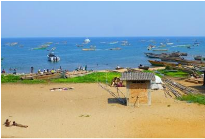
A la plage de Rumonge