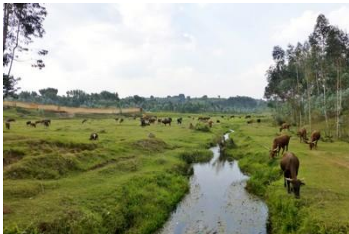
Rivière, vers Nyagasasa

Samedi 15 : Nuit excellente (boules Quiès), réveil vers 5H30, départ à 6H. Beau temps. Je me rends jusqu'à la source d'eau chaude de Muhweza, où nous sommes passés lundi. Route puis mauvaise piste, j'y suis à 6H30. Je pensais être seul, vu l'heure matinale et que c'est samedi, la matinée du travail communautaire obligatoire. Eh bien je me suis trompé : lorsque j'arrive il y a déjà une quinzaine de personnes dans le bassin des hommes. Derrière les fourrés, on entend aussi rire des femmes, dans leur bassin. En maillot, je me plonge dans cette eau chaude, ça fait du bien et ça dégrasse, je n'ai pas pris de douche ce matin. Les hommes et les adolescents se lavent carrément au savon, nettoient aussi leurs bottes ou sandales, ce n'est pas très hygiénique, mais le débit d'eau est heureusement assez important. Des gens se rhabillent, c'est drôle, ils enfilent leurs vêtements crasseux, plusieurs couches, et s'en vont, leur chapeau sur la tête et leur bâton à la main. Ce sont des paysans du coin. Va et vient. Je ne me sens pas très à l'aise au début au milieu de ces autochtones qui parlent entre eux en swahili, rigolent, peut-être de moi, et m'ignorent. Des enfants viennent et se baignent, nus, tout comme deux adolescents de 17 ans. Au bout d'une bonne demi-heure, un homme jeune qui vient d'arriver m'adresse la parole : « C'est