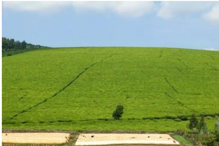
Plantation de thé, vers le parc national de la Kibira

Vendredi 7 : Nuit un peu bruyante : aboiements de chiens, klaxons de voitures et un moustique taquin. Nuit un peu courte : on vient taper à ma porte comme prévu à 5H (j'étais déjà levé depuis dix minutes). Une demi-heure plus tard, nous partons vers le lac Rwihinda, à quelques km. Une mauvaise piste nous conduit à ce lac, à 1420 m d'altitude, qui est aussi connu sous le nom de « lac aux oiseaux ». C'est en effet un sanctuaire pour les 49 espèces d'oiseaux aquatiques migrateurs qui viennent s'y reproduire. Beau lever de soleil et balade d'une heure en pirogue autour de l'île d'Akagwa, superbe par sa végétation luxuriante. Temps superbe, il fait un peu frais toutefois. A la rame, ainsi, c'est tranquille, reposant, et nous apercevons une multitude d'oiseaux : martins-pêcheurs, hérons, cormorans, ibis blancs, ibis noirs, aigrettes, becs-ouverts, canards etc... Par endroits, de petits îlots où se rassemblent ces derniers. Nombreux nénuphars. Quelques pirogues de pêcheurs aussi. Sur la rive, à notre retour, des fillettes et des femmes font leur provision d'eau. Au retour, arrêt près d'une case et photos de beaux tournesols, avocatiers et champs de sorgho. Plus loin, une fabrique artisanale de briques. Un troupeau de vaches aux longues cornes obstrue la piste quelques instants. Petit-déjeuner à notre hôtel de Kirundo vers 7H30 et départ peu après.