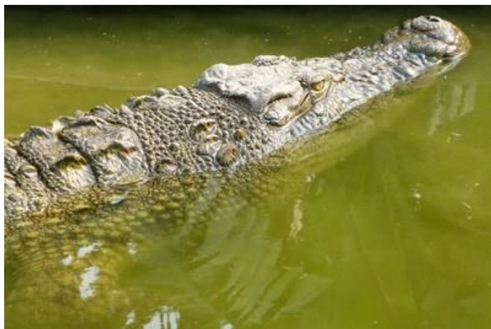
Crocodile, ferme vers Rusuzi