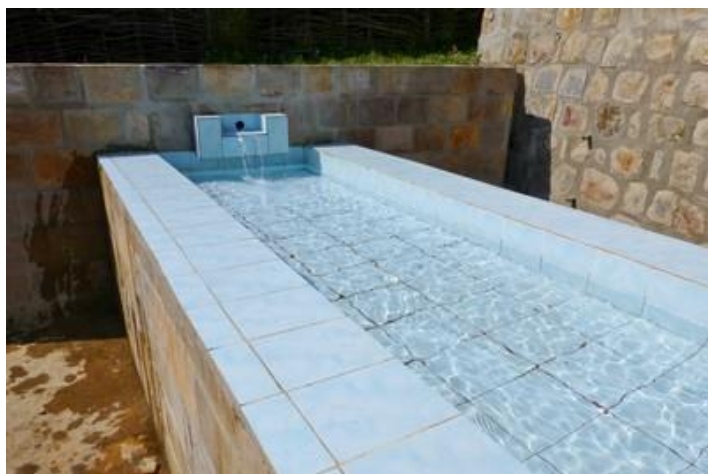
La source du Nil Blanc