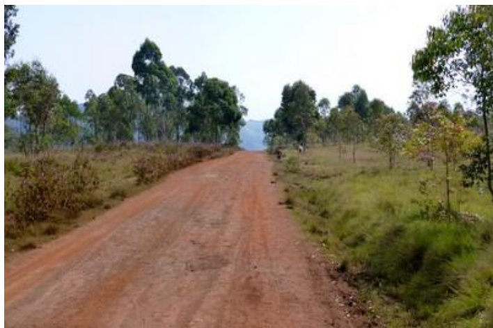
Piste de Muyagoro à Kiryama

vrai que si l'on tue un homme on va directement au paradis ? ». Je m'empresse de le contredire, n'en menant pas large. Finalement nous discutons agréablement un bon moment. Je reste là trois bonnes heures, puis reprends la piste en sens inverse, en déposant trois personnes au village suivant.