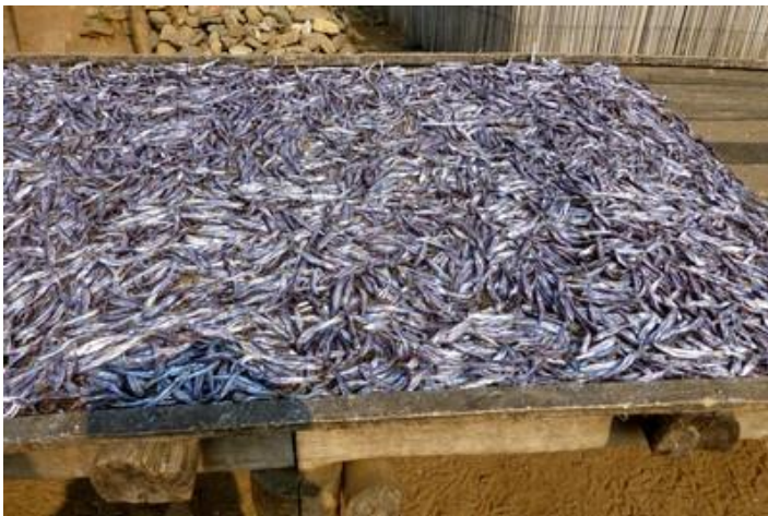
Au port de pêche, Giteza