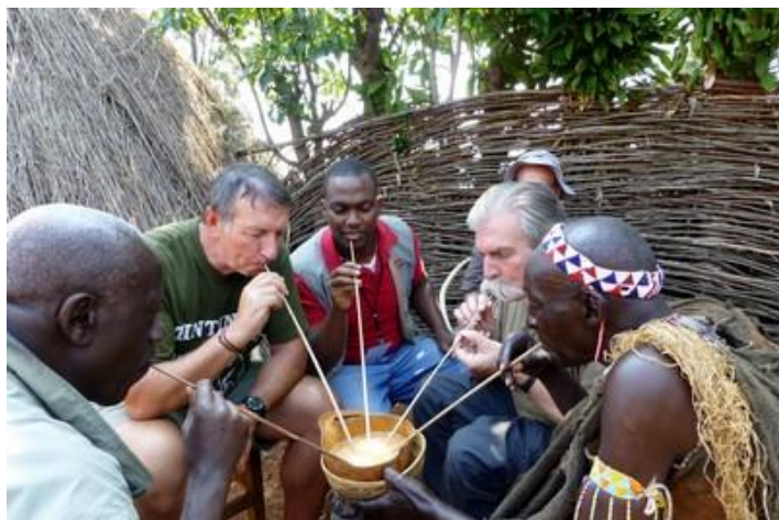
Dégustation de bière de banane, Gishora

aux autochtones), le palais royal (une simple maison), le tout abandonné et en assez triste état. Cependant, le petit musée national de deux pièces est très intéressant. La première salle accueille des expositions temporaires, la seconde expose les instruments utilisés dans la vie de tous les jours à des époques différentes. La vitrine exposant les instruments de musique m'intéresse tout particulièrement. Nous retournons ensuite à l'hôtel, peu après 16H. Quartier libre jusqu'à 19H, travail. Le dîner est prévu à l'extérieur et je décide de le sauter : non seulement je n'ai pas vraiment faim, mais je veux mettre mon site à jour sans me coucher trop tard. Ce que je fais, à 23H je dors déjà, tandis qu'une mise en ligne de certaines de mes vidéos se fait sur YouTube (c'est extrêmement long).