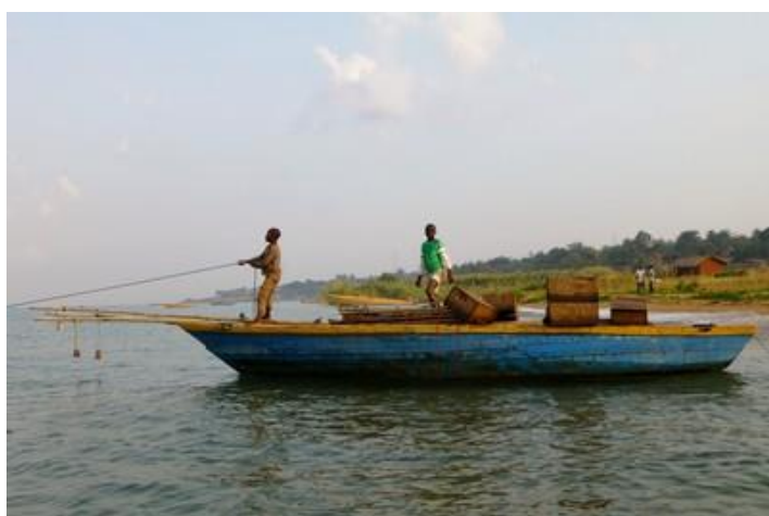
Sur le lac Tanganyika

Le lac Tanganyika est l'un des Grands Lacs d'Afrique, deuxième lac africain par la surface après le lac Victoria, le deuxième au monde par le volume et la profondeur après le lac Baïkal. Il est le plus poissonneux du monde. Ses eaux rejoignent le bassin du Congo puis l'océan Atlantique. Il couvre une superficie de 32 900 km 2 (approximativement la même superficie que la Belgique) et s'étire sur 677 km le long de la frontière de la Tanzanie (à l'est) et de la République démocratique du Congo (à l'ouest) ; son extrémité nord sépare ces deux pays du Burundi, son extrémité sud les sépare de la Zambie. Il abrite au moins 400 espèces de poissons (cichlidés ou non, la plupart endémiques), dont la plupart vivent le long de la côte jusqu'à environ 180 mètres de profondeur.