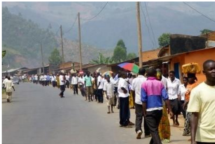
Marché et sortie d'école à Nyabirara