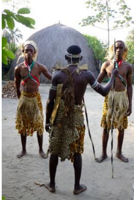
Spectacle au Musée Vivant