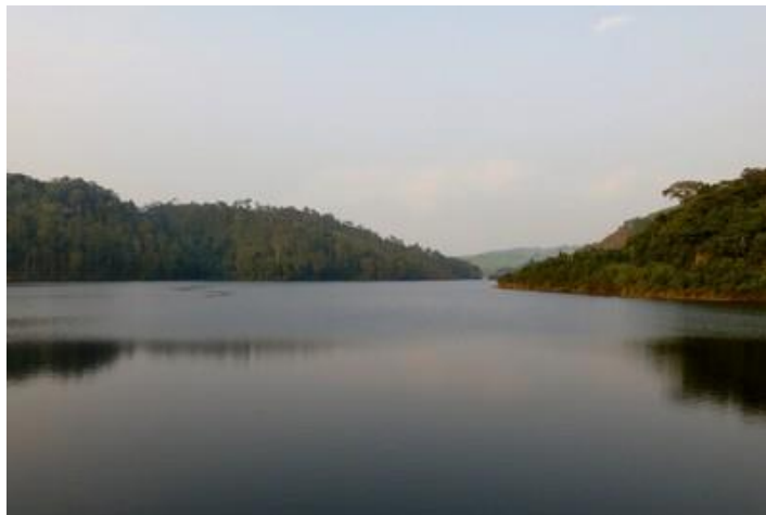
Lac artificiel de Rwegura

Vendredi 14 : Très bonne nuit. Réveillé peu avant 5H, c'est bien, j'ai mes 7 heures de sommeil. La Wifi ne marche toujours pas ; mais ce qui m'inquiète le plus, c'est l'état de mon ordinateur qui se bloque sur des programmes et que j'ai été obligé d'éteindre et de rallumer à plusieurs reprises. Il fait frais ce matin, altitude oblige. Un seau d'eau chaude m'est amené pour la douche, mais sans gobelet, difficile de me laver correctement. Je quitte l'hôtel à 7H, ma voiture a été superficiellement lavée par un jeune sans que je le demande, pourboire obligé. Les rues de Kayanza regorgent de gens, à pied, en vélo, à pied poussant le vélo (ça monte). Il doit y avoir un marché par là. Je prends la RN1 vers le sud, route que nous avons prise dans l'autre sens il y a huit jours. Ça descend pas mal et, en face, des cyclistes se font trainer, accrochés à l'arrière de