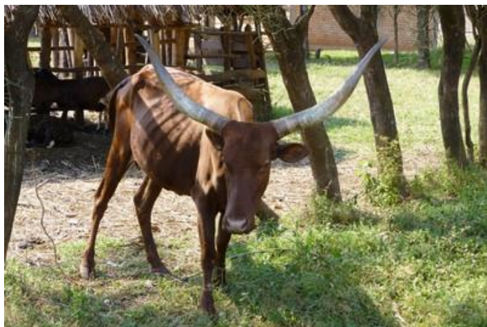
Vache maigre, Shanga