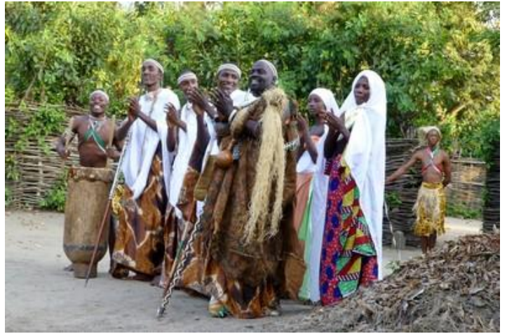
Spectacle au Musée Vivant, Bujumbura