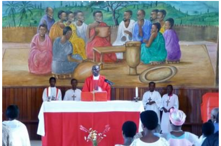
Messe à Muyama

Cap vers le sud-ouest, vers le lac Tanganyika. La bonne piste descend pas mal tout le long de ses 30 km (850 m de dénivellé). Beaucoup de monde endimanché aux alentours des villages traversés. Ils vont à la messe. Ou ils en sortent... Partout, comme hier, de grandes églises de briques, certaines en construction. Superbes paysages. Et c'est encore plus beau en arrivant vers Mudende, à 10 km du lac : des forêts de palmiers à perte de vue. L'huile de palme est très utilisée au Burundi, grosse production. Vers 10H30, me voici à Rumonge, au bord du lac, où nous sommes allés à la Poste il y a quelques jours. Dans un hôtel-restaurant, j'arrive à échanger des euros, je n'avais plus un sou en poche. Je perds presque une heure et le taux n'est pas bon, mais je ne peux faire autrement. Puis je fais un petit tour au port de pêche et sur la plage de sable attenante où de nombreux enfants nus se baignent. Forte population musulmane dans le coin (plusieurs mosquées à Rumonge). Je continue en longeant le lac vers le nord, vers la capitale. La route n'est pas très bonne, pleine de trous, mais jolie, bordée de palmiers. Quelques rivières, descendant de la montagne, se jettent ça et là dans le lac. Beaucoup de voitures, taxis et minibus, qui roulent très vite. Pratiquement aucun accès au lac, c'est dommage. Il fait très chaud. De nombreux militaires patrouillent partout, à pied ou en camions, je ne sais pas ce qu'il se passe (peut-être simplement un déplacement du président).