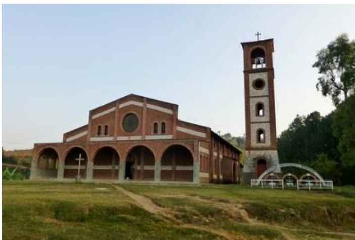
L'église de Muyama