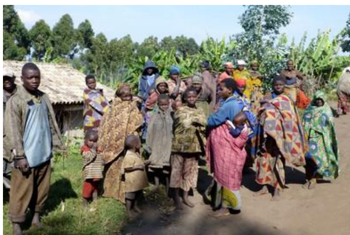
Au village batwa de Busekera