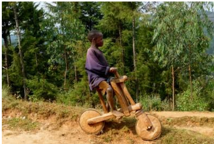
Enfant au vélo de bois, Ruvumvu