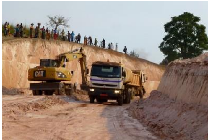
Travaux sur la piste de Gasave