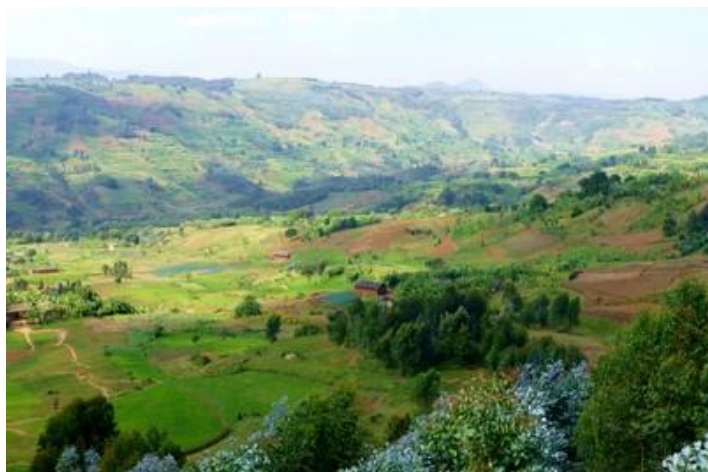
Paysage vers Busekera