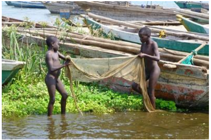
Jeunes pêcheurs au filet, plage de Rumonge