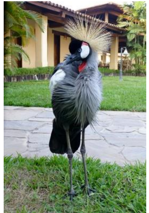
Grue couronnée à l'hôtel, Bujumbura