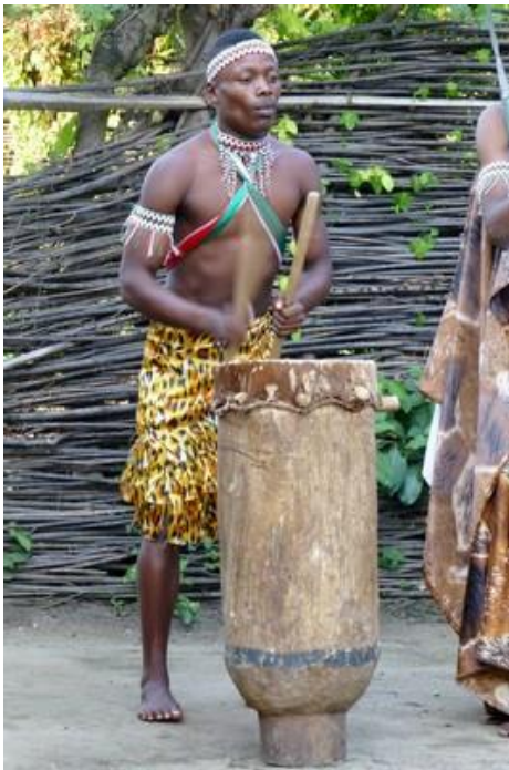
Spectacle au Musée Vivant, Bujumbura