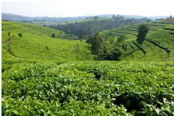
Plantation de théiers, Mugamba

Après Bururi, la RN16 se transforme en assez mauvaise piste de latérite sur 22 km. Nous rejoignons la bonne RN7 et l'empruntons vers le nord-ouest. A 13H40, arrêt pique-nique dans l'herbe au bord de la route vers Vyuya : sandwiches et fruits. Au loin, des enfants nous observent manger. Un peu plus loin, vers Mugamba, belles plantations de théiers. Plus au nord, autre arrêt vers Nyakararo afin de visiter une propriété traditionnelle : hutte d'habitation, enclos pour le bétail, greniers à maïs, champs et prairies. Enfin, vers 16H, nous arrivons sur les hauteurs de Bujumbura. La petite randonnée prévue (où ?) n'a pas été faite. Le ciel est maintenant parsemé de nuages, pour la première fois depuis que nous sommes au Burundi. La route descend vers la capitale et nous nous arrêtons au Musée vivant afin de visiter les boutiques d'artisan. J'y achète un arc musical (umuduri) que je suis obligé de faire couper en deux car trop grand pour voyager. Puis nous rejoignons l'hôtel, le même que le premier jour, et sommes dans nos chambres dès 17H15. Je travaille toute la soirée et ne sors pas dîner à l'extérieur avec mes amis, pas le temps, c'est toujours trop long et demain nous repartons tôt. Je termine vers 22H30.