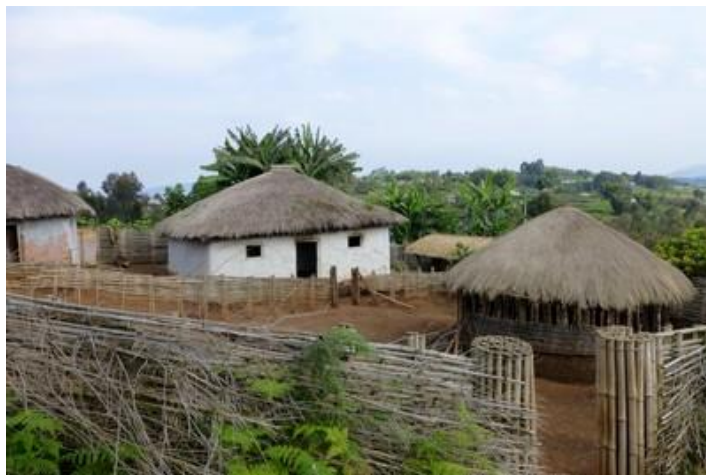
Maison traditionnelle, Nyakararo