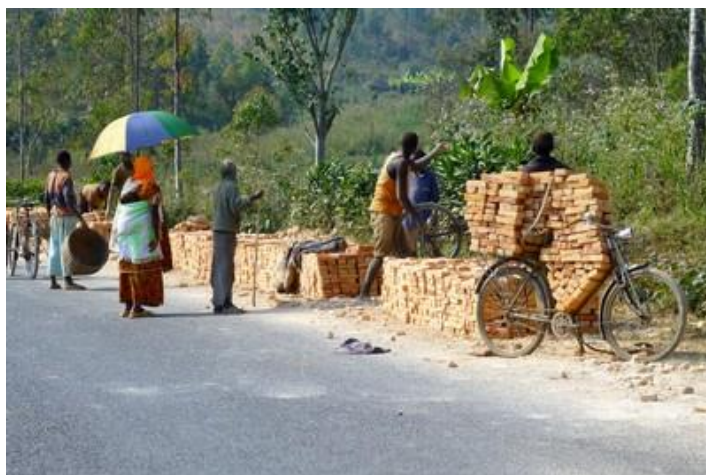
Transport de briques, vers Rutana

Vers 15H30, nous repartons direction sud-ouest par une assez bonne route, si l'on excepte quelques trous et les nombreux gendarmes couchés qui ne sont visibles qu'au dernier moment. Ca tourne pas mal et le paysage est magnifique. 45 minutes plus tard nous arrivons à Nyanza-lac, ville d'environ 130 000 habitants située à 125 km au sud de Bujumbura et 13 km au nord de la Tanzanie, au bord du lac Tanganyika. Il fait assez chaud, nous sommes redescendus à 770 m d'altitude. Notre hôtel est justement tout au bord du lac. Où je pique une colère parce qu'on nous donne des bungalows sans eau chaude à 10 euros parce que ceux avec eau chaude coûtent 15 euros ! (« hôtel confortable »). Faudrait quand même arrêter de