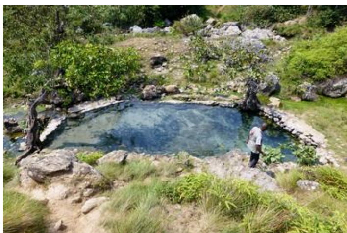
Source d'eau chaude de Muhwesa