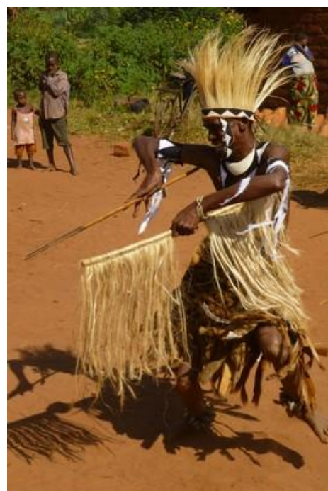
Danseur-guerrier Intoré, Kirundo

Le parc national de la Ruvubu est le plus grand du pays (50 000 hectares) ; il abrite 425 espèces d'oiseaux et de nombreux mammifères : antilopes rouanne, oréotragues, hylochères, buffles, colobes, hippopotames, potamochères, phacochères etc... Pique-nique correct dans un lodge en construction laissé à l'abandon. Un peu plus loin, nous pouvons observer des grivets, bizarrement appelés aussi singes verts, alors que les mâles ont les testicules bleus (ce qui n'est pas le cas des femelles). Ils sont magnifiques avec leur belle fourrure et leur museau noir encadré de poils blancs. Vifs, ils viennent s'emparer, à une vingtaine de mètres de nous, des morceaux de patates douces que leur lance un garde. Puis un sympathique guide nous accompagne pour deux courtes balades à pied, près de la rivière Ruvubu bordée de papyrus, à la recherche d'animaux. Rien. A part une tête d'hippopotame, loin dans la rivière, et que je n'arrive même pas à voir, rien du tout ! Ce qui n'est pas étonnant, vu l'heure de la visite et, à proximité, les va-et-vient incessants dus aux énormes travaux routiers. Il aurait au moins fallu dormir une nuit ici ! Du coup, un peu déçus, nous revenons à Muyinga et nous arrêtons rapidement au marché. La plupart des commerçants sont des musulmans, nombreux ici à cause de la proximité de la frontière tanzanienne et facilement reconnaissables. Mais interdiction de prendre des photos, comme dans tous les marchés du pays, dommage.