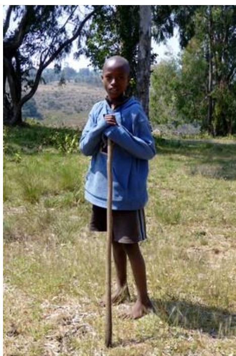
Jeune berger, Nyakazu