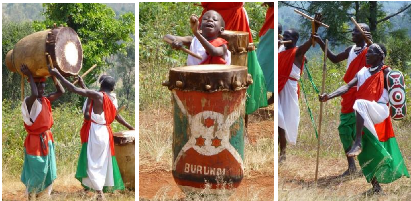
Les tambourinaires sacrés, Gishora

années 1910. On y trouve donc une enceinte royale (branchages tressés) et, à l'intérieur, une cour publique, une hutte royale, d'autres huttes (cuisine, sanctuaire des deux tambours sacrés...) et une cour privée. L'endroit est très chouette et la visite intéressante. La hutte royale, notamment, est superbe (plafond de papyrus admirablement tressé). Pour servir le roi, une troupe de tambourinaires s'était formée et existe toujours : les tambourinaires sacrés de Gishora, célèbres dans le monde entier. Les tambours sont creusés dans du bois d'umuvugangoma (appelé aussi cordia africana ), un arbre de la région, et recouverts d'une peau de vache.