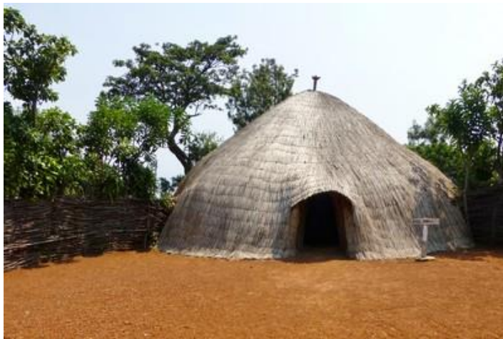
La hutte royale, Gishora

Samedi 8 : J'aurais pu faire la grasse matinée jusqu'à 7H, mais le muezzin, l'enfoiré (et je pèse mes mots), me tire de mon sommeil vers 5H, réveillant aussi des corbeaux qui courent sur le toit de mon bungalow en faisant un raffut pas possible. Bien que fatigué, je me lève donc, que faire d'autre ? Ce qui me permet de mettre à jour mon site. Petit-déjeuner copieux (grosse omelette) et départ à 8H. Pratiquement aucun véhicule dans les rues : partout au Burundi, tous les samedis, de 6 à 10H, les automobilistes n'ont pas le droit de circuler et la police veille. Et pourquoi cela, me direz-vous ? Bonne question. Eh bien, ce sont les horaires du travail communautaire obligatoire pour tous, hommes, femmes, enfants : nettoyage des rues, construction d'écoles, déblayage des caniveaux et toutes sortes d'autres travaux. Cela paraît plutôt bien, mais environ 70 % des familles pensent que cela a été récupéré par le parti politique au pouvoir et refuse de l'accomplir. Mais que fait la police ? (ah ah ah). En effet, beaucoup de personnes discutent en petit groupe, font leurs achats, se déplacent en vélo, des enfants jouent au ballon etc... Les établissements scolaires sont fermés le week-end. Eddy m'explique que les autres jours les écoliers ont cours de 7H30 à 11H30 et de 12H30 à 17H30 (ça me semble beaucoup), et les collégiens et lycéens de 7H30 à 13H. Excellente route vers le sud-ouest sur 93 km jusqu'à Gitega. Petit arrêt en cours de route après avoir traversé la Ruvubu vers Rugajo.