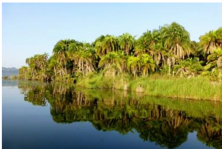
Ile Akagwa, lac Rwihinda, Kirundo

Vendredi 7 : Nuit un peu bruyante : aboiements de chiens, klaxons de voitures et un moustique taquin. Nuit un peu courte : on vient taper à ma porte comme prévu à 5H (j'étais déjà levé depuis dix minutes). Une demi-heure plus tard, nous partons vers le lac Rwihinda, à quelques km. Une mauvaise piste nous conduit à ce lac, à 1420 m d'altitude, qui est aussi connu sous le nom de « lac aux oiseaux ». C'est en effet un sanctuaire pour les 49 espèces d'oiseaux aquatiques migrateurs qui viennent s'y reproduire. Beau lever de soleil et balade d'une heure en pirogue autour de l'île d'Akagwa, superbe par sa végétation luxuriante. Temps superbe, il fait un peu frais toutefois. A la rame, ainsi, c'est tranquille, reposant, et nous apercevons une multitude d'oiseaux : martins-pêcheurs, hérons, cormorans, ibis blancs, ibis noirs, aigrettes, becs-ouverts, canards etc... Par endroits, de petits îlots où se rassemblent ces derniers. Nombreux nénuphars. Quelques pirogues de pêcheurs aussi. Sur la rive, à notre retour, des fillettes et des femmes font leur provision d'eau. Au retour, arrêt près d'une case et photos de beaux tournesols, avocatiers et champs de sorgho. Plus loin, une fabrique artisanale de briques. Un troupeau de vaches aux longues cornes obstrue la piste quelques instants. Petit-déjeuner à notre hôtel de Kirundo vers 7H30 et départ peu après.