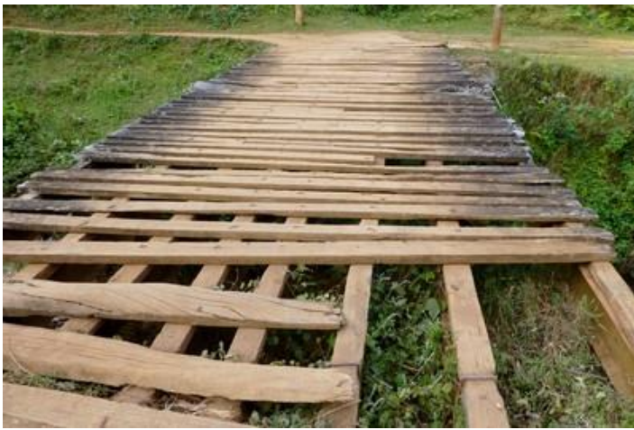
Pont en piteux état, avant Muzenga