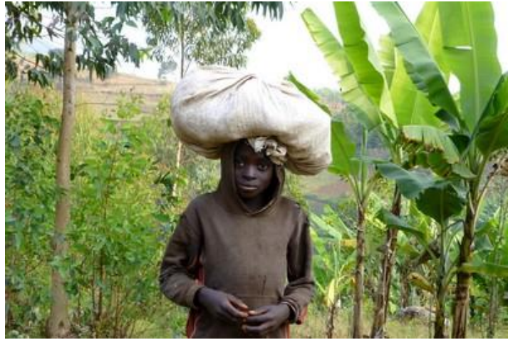
Enfant au sac, Muzenga