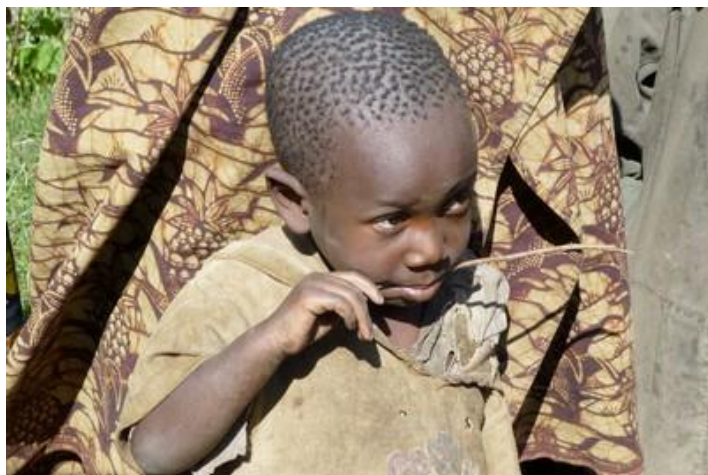
Petit garçon du Burundi