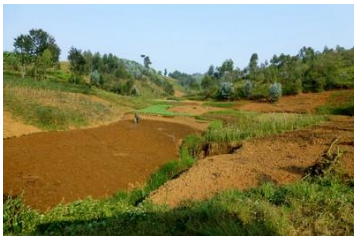
Paysage vers Banga

camions. Beaucoup de briqueteries le long de la route, des enfants très jeunes (7-8 ans) y travaillent. Je double plusieurs vélos transportant trois passagers, il faut le faire. Il faut être musclé pour se déplacer en bicyclette au Burundi : ça grimpe tout le temps. A Bugarama, je fais quelques achats (eau, avocat, pain, biscuits) puis emprunte une piste pour me rendre vers Mugongo. 10 km plus loin, la piste devient très mauvaise et je dois abandonner mon projet, bifurquer vers Isare, Kiromwe et Buhonga où j'arrive vers 11H30 au bout de 40 km.