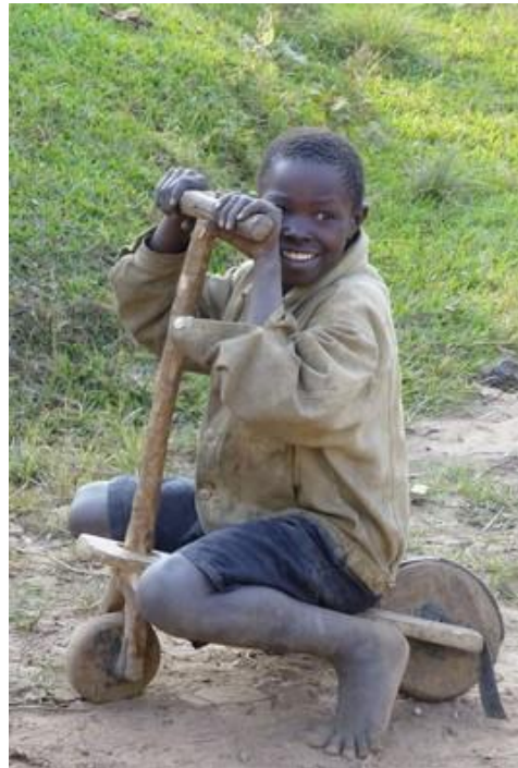
Enfant à la trottinette, Vyuma