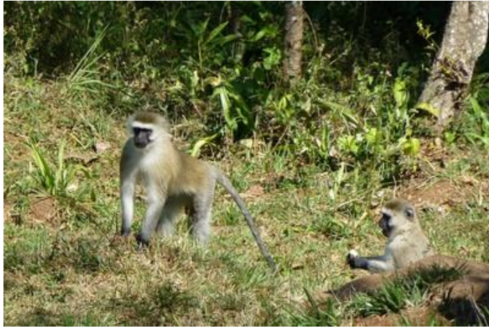
Singes verts (grivets), parc National de la Ruvubu