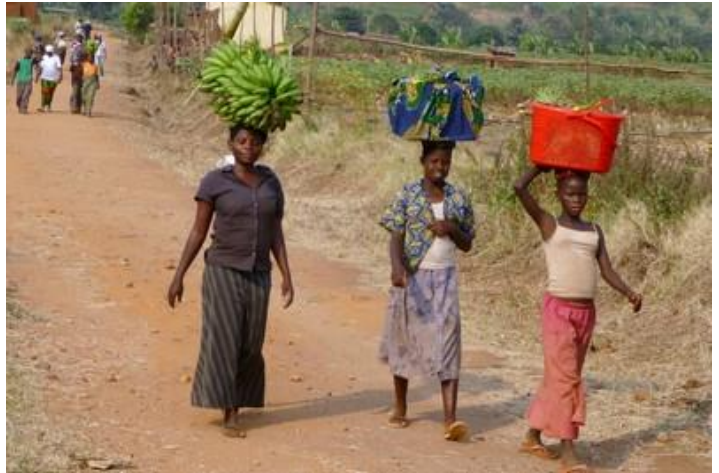
Femmes, vers Kabezi