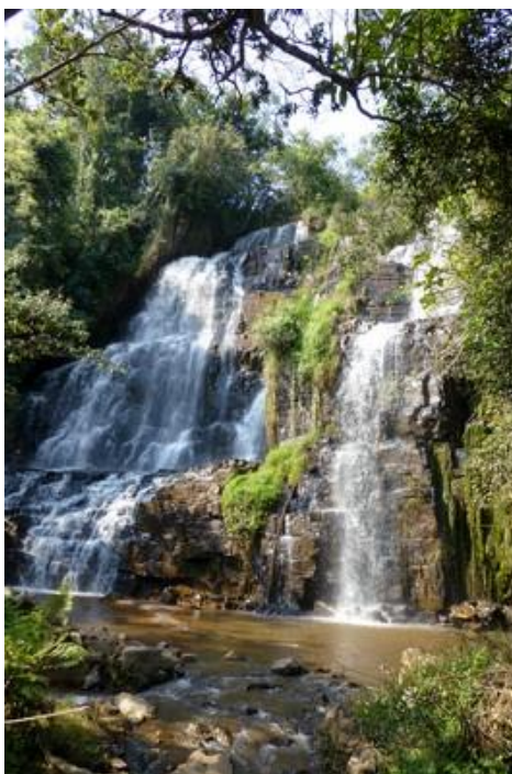
Chutes de la Karera