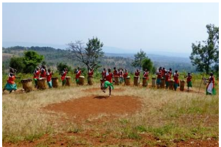
Les tambourinaires sacrés, Gishora